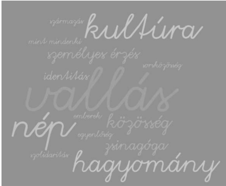
3. ábra: Aggregált szófelhő a háromszor vagy annál gyakrabban előforduló szavakból a foglalkozás utáni asszociációk alapján ( n = 238 ). Megjegyzés: Az ábra a MAXQDA 12 és a Word It Out szoftverekkel készült

Ha nem is lehet messzemenő következtetéseket levonni két osztály asszociációiból, azok egyrészt alapot adhatnak a kvantitatív eredményekkel való összevetéshez, másrészt jól illusztrálják, hogy osztályonként is eltérések vannak a foglalkozásokban és azok hatásában. Ez természetesen a diákokra is igaz: mindenkit másképp és más fog meg a 90 perc alatt elhangzottakból.