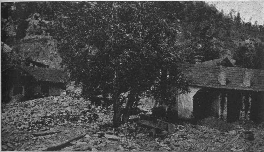
1. Igazgatósági udvar és kert.

1—3. rajzok. Részletek a Dobrawerkről, a június 13-án pusztított felhőszakadás után.