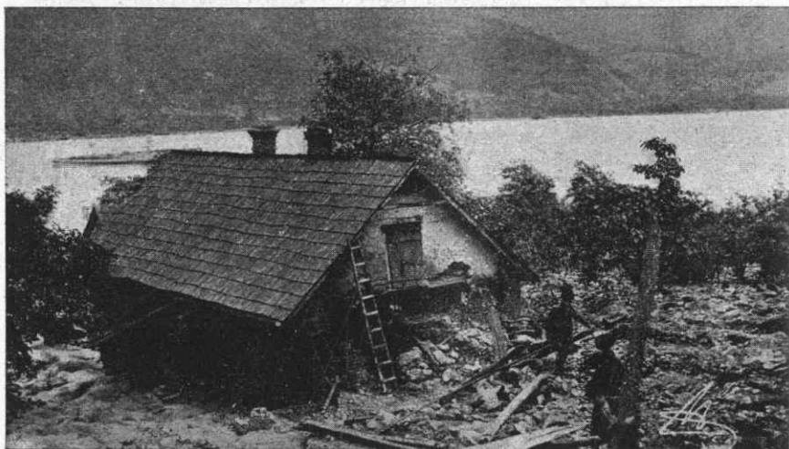
3. Altiszi lakás.

donyzín egyik oldala teljesen hiányzik. A vasút 8 kilometer hosszban teljesen használhatatlan, a sínek sok helyütt a levegőben lógnak. A Koritza patak mentén levő támfalakat az utolsó köig elhordta az ár.