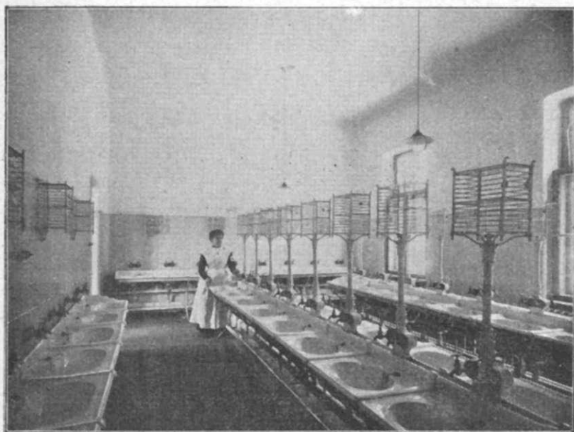
4. kép. Közös mosdó.