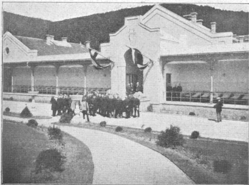
1. kép A t-lep homlokzata, fekvő folyosókkal.

Abból az alkalomból, hogy a m. kir. pénzügyministerium f. évi október hó 19-én 116117. sz. a. kelt körrendeletével, a kir. kincstári bánya- és kohóhivatalak figyelmét az algyógyi munkás-szanatoriumra