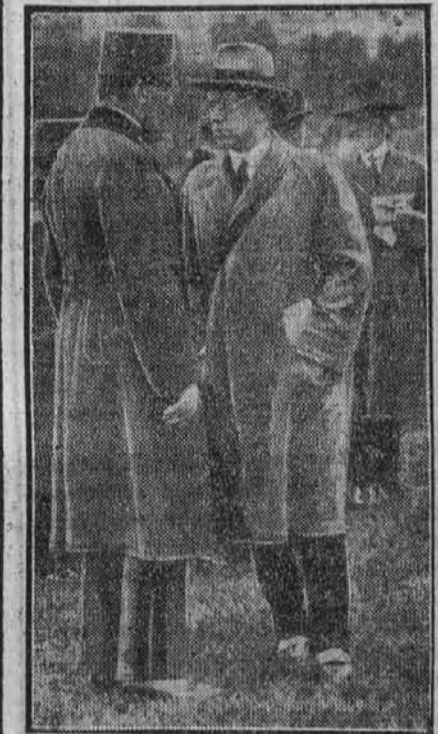
Albrecht főherceg pápaszemmel jelent meg a vasárnapi tereplóvágás utáni között a vérmezőn

— Dehogy szoknek, dehogy szoknek! Windischgrätzről azt híresztelték, hogy szokési tervekkel foglalkozik s hogy nem óhajt megjelenni a fővárosi tárgyaláson. Nem valószínű, hogy ez valószínű legyen. Windischgrätz és társai nem építenek légvárakat. Bizonyosra lehet venni, hogy odaállanak a bíróság elé, sőt már most próbálják is a tükörben azokat a pózokat, amelyeket majd felölteni fognak. Az összes frásokat könyv nélkül tudják s a mellükre is olyat vágunk, hogy csak úgy döng. Dehogy engedik ők el ezeket a nagy jeleneteket! Mérges lehet rá venni, eljátszszak egytől-egyig valamennyit.