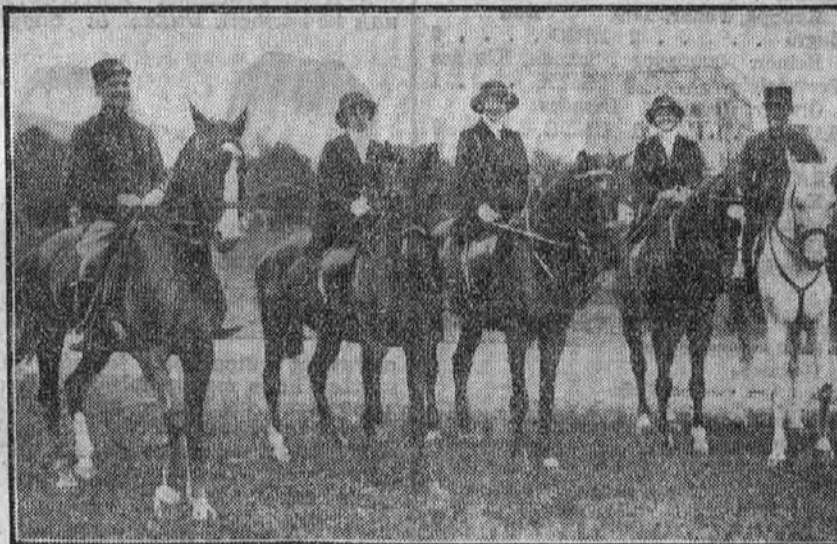
A vasárnapi Andrássy Géza-tereplovaglási hölgyrészlvevői a Vérmézőn

herceg ezáltal szemüveggel, akinek derült kalandja volt a fotoreporterekkel. Mikor fotoreporterünk elcséttintette gépét, a fenség hirtelen lekapta szemüvegét — azonban már későn. A többi fotoreporter azután órákig kerülgették a főherceget, hogy szemüveggel lefotografálják, azonban a főherceg óvatoss volt s többé nem tette föl a sárgakeretes pápaszemét.