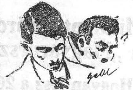
Fáradt ember könnyen elalszik

— Úgy van! Végre! Halljuk, mi lesz? — hangzott innen is, onnan is. Es ez volt az utolsó hangosság, mert ettől kezdve, '45 lehetett már, eldőltek