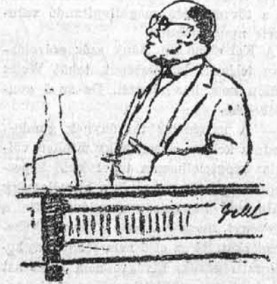
Pajor elvtárs beszél