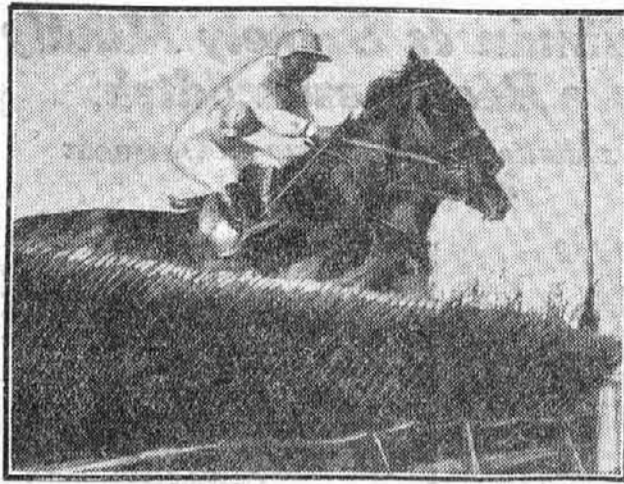
A meyeri megnyitó lóverseny