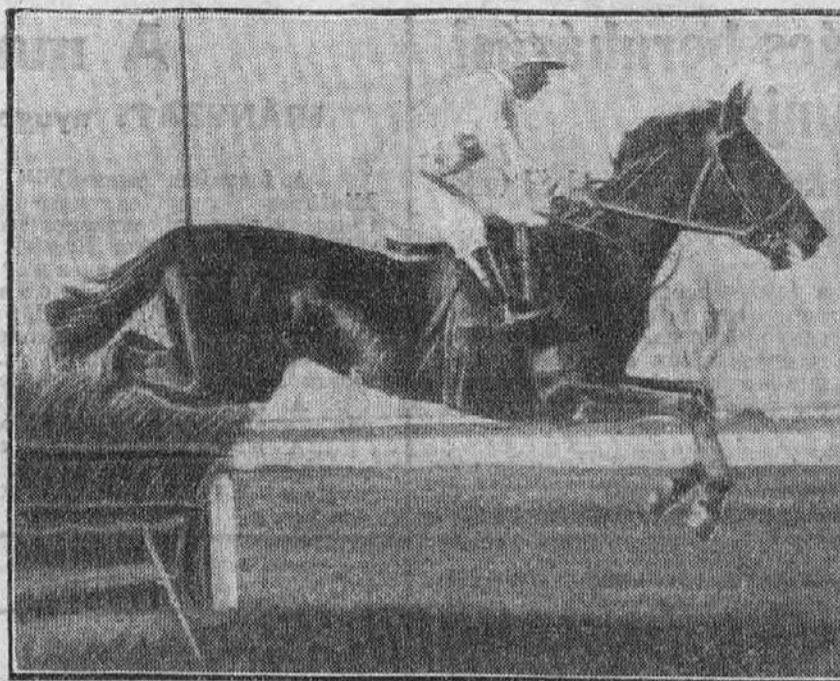
A magyar megnyitónapról. Mit szól hozzá? gálat ugrik

Hétszobás urasági lakás a Városligetben, a legjobb iparművész által decemberben berendezve, bútorozva vagy anélkül. Átdad. [írsef 120-00]