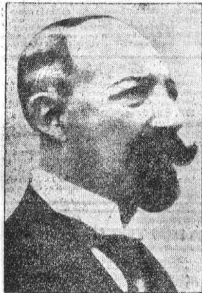
De Guise János herceg, a minap elhunyt Fülöp orléansi herceg unokaöccse, akit a francia monarchista párt mint III. Jánost a francia királyi cím legitim örökösének proklamált.

A frankügy kísértete. Az Okolicsányi- és Pödör-féle ügy újra megelevenedik, kihallgatásokról olvasunk és maholnap ebben a homályos kérdés-labirintusban is meggyújtják a bírói bölcsesség világitó fáklyáját. Nem akarunk elébe vágni ennek az egyedül hivatott bírói világosság-teremtésnek, csak azt a furesza érzésünket írjuk itt le, amely az eddig kiszivárgott adatokkal kapcsolatban fut végig inkább a sejtelminkben, mint a tudatunkon. A homályban ugyanis mintha különös kísértetek mozdulnának meg, elmosódó körvonalakkal, csak egy-egy pillanatra villantva meg visszataszító arcukat. Kísértetek, amelyek előbb a frankügyben lebbentették meg lepedőjüket s most mintha ebben a másik ügyben is jelentkezni akarnának, mint afféle hazajáró lelkek, akik itt is otthon vannak. Nem merünk hinni ezeknek az egyelőre zavaros, bizonytalan kapcsolatoknak, nem merjük hinni, hogy az Okolicsányi-Pödör-ügynek köze van a frankbotrányhoz is és nagy felszabadulás, igazi fellélekezés volna minden magyar lélek számára, ha az igazság napfényében semmivé oszolnának azok a fenyegető ólálkodó kísértetek.