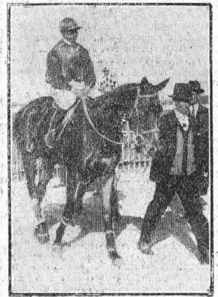
Little Girl, a magyar akadémia verseny győztese