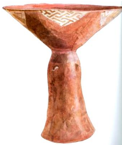
Csőves talpú tálka (Zseliz Protolengyel horizont, Sopot kultúra, Brezovljani típus).

Ezután valódi csoda következett: egy gyönyörű, fényesre csiszolt kőbalta! Majdnem fekete kőből volt, nagy, zöld foltokkal, a nem túl sötét malahit, zöld árnyalataival. Sehol egy sérülés, vagy csorba a felületén. Látszott rajta, hogy a remekmű valószínű tulajdonosa, akinek a sírjában találták, éppen meghalt, amikor megkapta. De, ha egy ilyen csodaszerszámot néhány óra alatt el lehetne készíteni, inkább arra gyanakodnék, hogy az illető halála után, veletemetési céllal csinálták, mert annyira használatlannak tűnt. Dombay azt mondta, hogy azt a követ, amiből készült csak a Perzsa-öböl környékén találni. Tehát a zengővárkonyi ősök onnan hozták magukkal, amikor idevándoroltak, vagy állandó kereskedelmi kapcsolatban álltak az „öblikkel”.