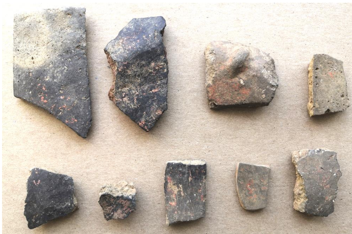
Cserépdarabok, amelyeken a pipacspiros festék nyomai látszanak (több ezer éves szántóföldi hányatottság és napfürdő után!).