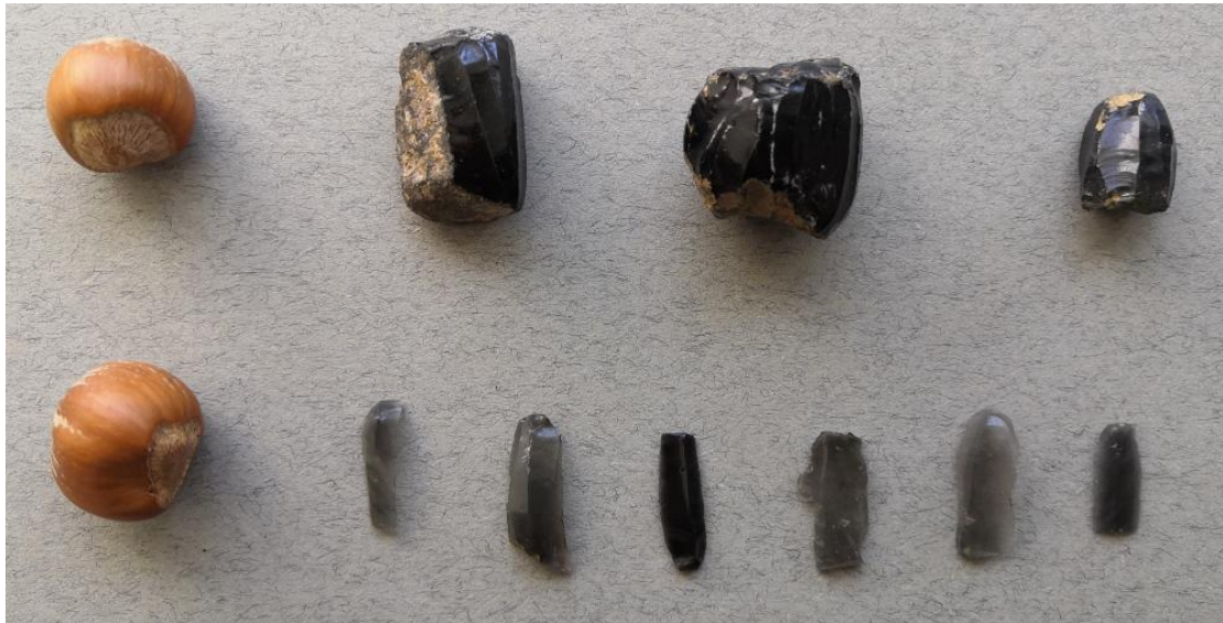
Mogyoró nagyságrendű obszidián magkövek és néhány lepattintott penge. Ezeknél sokkal nagyobbakat – tudtommal – nem találtak Zengővárkonynál. A pengék – noha évezredek óta hányódtak a szántóföldön – élesebbek a borotvapengénél és olyanok, mint újkorukban.

A kova keményebb az üvegnél, amit karcolni lehet vele. „Kagylós törésű” anyag, ami azt jelenti, hogy ha egy élét kicsit ferdén megnyomjuk valami szívós anyaggal, mondjuk csonttal, akkor egy kis, kagylóalakú csorbát ejthetünk rajta. Ezzel az aprólékos technikával pontos nyílhegyeket alakítottak ki az ősemberek már több, mint tízezer évvel a zengővárkonyiak előtt. Ha jól tudom, ilyen nyílhegyeket nem találtak Zengővárkonynál.