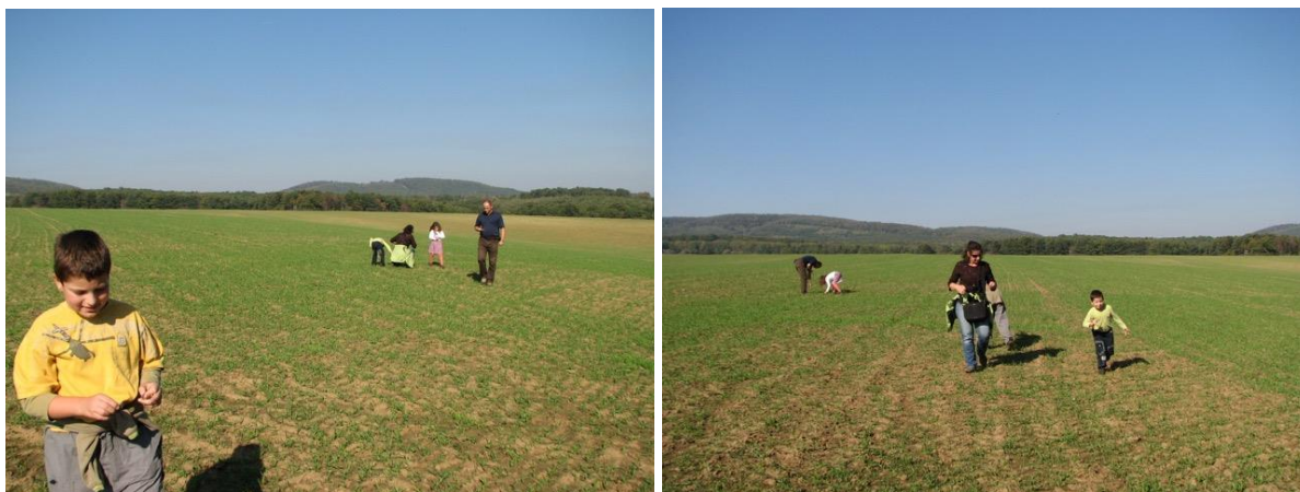
A zengővárkonyi lelőhely a nagy hársfától 10-15 méterre, Észak-Nyugat felé tekintve.

Gyerekkoromban sokat bóklásztam Nádasd környékén, hol rákpatákat keresve, hol gombászás közben, hol pedig érdekes színű agyagfajtákat kutatva. Egyszer a Nádasdtól Keletre lévő Ófalutól kicsit Északra, a berekaljai erdő egy dűlőútjának a falában megcsillanni láttam valamit. Obszidiánpengék és cserepek álltak ki a földből. Pontosan olyanok voltak, mint amelyeneket Zengővárkonynál is találtak. Az obszidián tűzhányókban keletkezett üveg és ugyanúgy pattintották, mint a kovakövet. Sajnos, amikor 1979-ben, 23 év után újra Magyarországon jártam, hiába kerestem azt a dűlőt, ahol 40 évvel azelőtt bandukoltam utoljára. Azóta ott mindent eltakarta a növényzet. Tájékozódni se tudtam, mert azok az utak már régen használatlaná váltak és részben teljesen eltűntek. Nem nagy kár, mert ennek a kultúrának az egész Dunántúlon sok lelőhelye van. Olyan maradványának lelőhelyét föltárni, amelyre erdő telepedett, amúgysem lett volna érdemes.