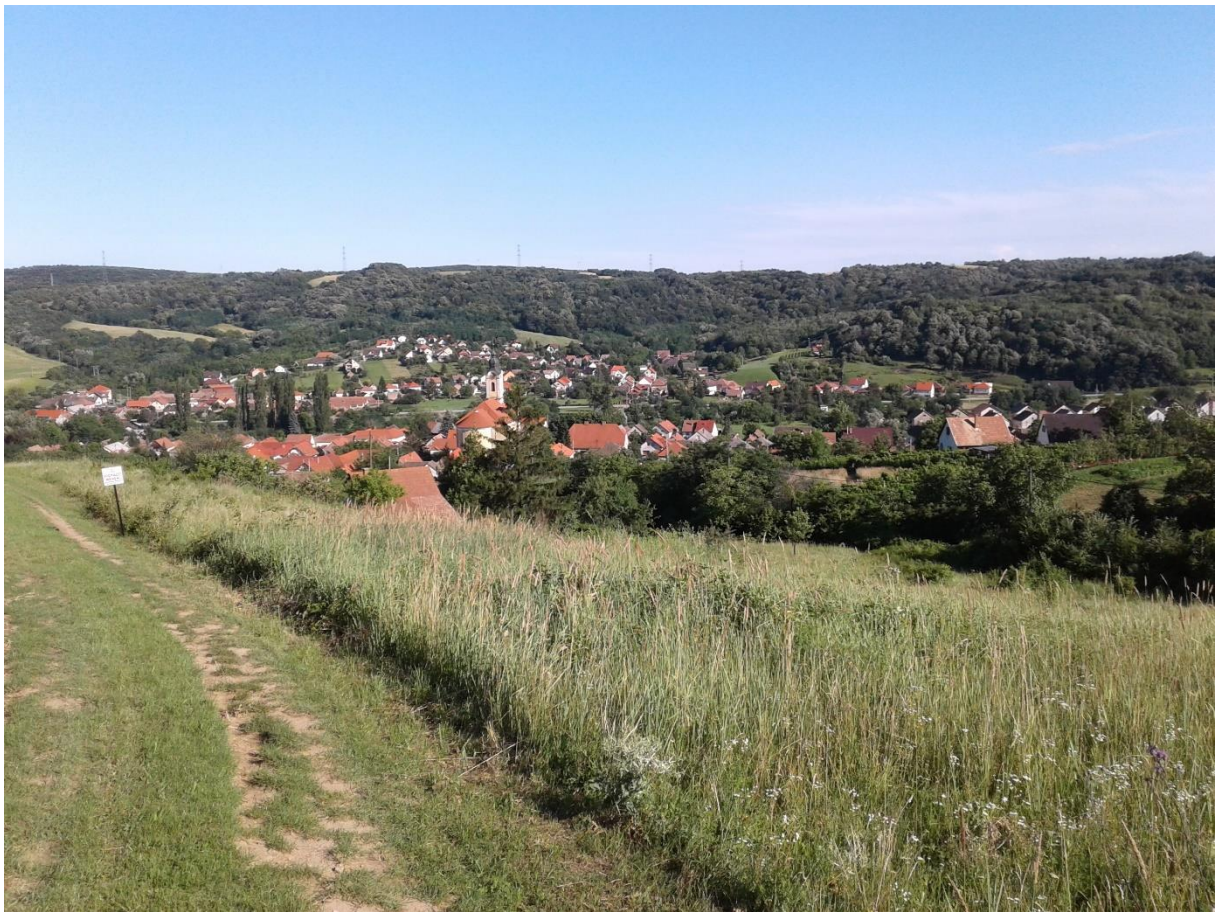
Mecseknádasd délfelé tekintve. A faluból alig látszik valami.

némelyik térképen a Halászpatak nevet viseli, megengedték a szabadon választott áthaladást, ám a másik vizet mesterséges mederbe kényszerítették, átvezették a falun és malompatakat csináltak belőle. A Rékavölgy patakját – amelyre a halászpatak név körülbelül olyan túlzás, mintha a teniszcipőmet hétmérföldes csizmának nevezném – mi egyszerűen vadpataknak hívtuk. Kevés vizű, keskeny patak volt, sok helyen könnyen át lehetett ugrani, és a Halászpatak elnevezést látva, roszmájúak joggal kérdezhették volna, vajon mire halászik ez a patak? Pedig halacsók azért voltak benne, de azokra rajtunk, gyerekeken kívül senki nem vadászott. Volt benne – néha rengeteg – fürgecselle, itt-ott fogtunk egy-egy kövicsíkot (ami „nyávog”, ha kiveszik a vízből), ritkán egy-egy fenékjáró küllőt, amelynek ívháromszög alakú a keresztmetszete (mint az egykori Messerschmitt Me 262-es vadászgép törzsének) és mégritkábban egy-egy domolykót. Messze túl a falun előfordult néha a törpeharcsa és talán még más kisebb halak. Ám – hogy mentsem a patak, általam kicsit mostohán kezelt becsületét – a Rékavölgyben gyönyörű rákokat lehetett fogni. Azokhoz hasonló méretű és „zömökségű” folyami rákokat azóta se láttam sehol!