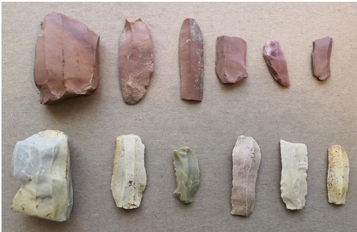
A kép baloldalán két magkő. Mellettük a pattintott kovakő pengék. Zengővárkonyonál főleg ebben a két színben találni a pattintott kőszerszámokat.