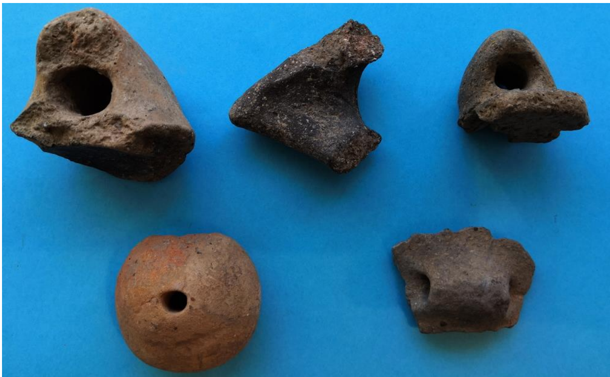
Óriási edények bütykei, melyeken a lukak függőlegesek voltak valószínűleg azért, hogy kötélen lógathatók legyenek. Baloldalon alul „szövőszék” alkatrész: nehezként lóghatott a lenfonálon.