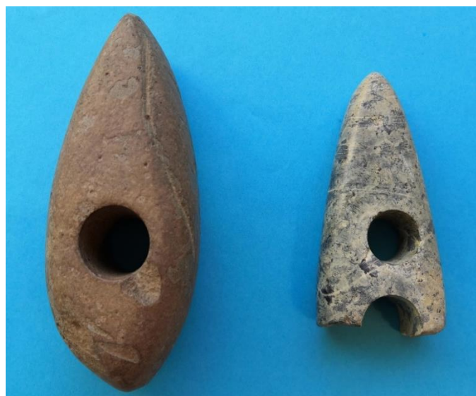
Egy kőkalapács („kőbalta”) nem túl szép anyagból és egy kettétört kőkalapács, amelyet a tulajdonosa (valószínűleg dühében) még egyszer átfúrt.

Itt meg kell jegyeznem, hogy a kőbalta szó, amit valószínűleg a németből vettünk át ( Steinbeil ), arra amit jelölünk vele, messzemenően helytelen és ezért nevetséges. A baltával fát lehet vágni – és vágnak is vele – mert acélból van és éles. A kőbalta viszont kőkalapács, vagy kőpöröly, amellyel az ősök nem szegeket vertek be, hanem diót, csontokat törtek föl, esetleg bőroket puhítottak. (Néha talán verekedtek is vele.) Fát semmiképpen nem vágta vele, mert arra a legkevésbé sem volt alkalmas. Kismórágyon találtak egy olyan kőbaltát , ami golyóalakú, tehát – szerintem – bőrpuhításra talán még alkalmasabb is lehetett, mint a kalapácsalakúak.