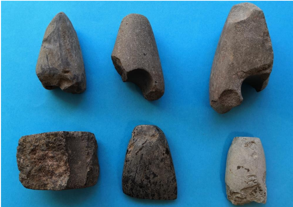
A felső sorban kőkalapács töredékek. Alul, baloldalon ugyancsak egy kalapács töredék, amelyen jól lehet tanulmányozni a fúrat felületének finomságát. És két Hántoló (?), vagy „kapa”. A jobboldali kakukktójs, mert nem Zengővárkony mellől származik, hanem a Nádasd és Ófalu közötti völgyből.