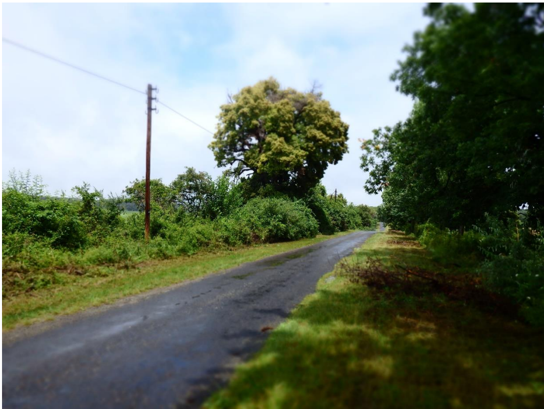
A nagy hársfa a zengővárkonyi lelőhely kellős közepén. A régi országút Pécsvárad és Nádasd között (amit eredetileg a rómaiak építettek). A képtől jobbra közvetlenül vezet a 6-os számú műút Nádasd felé, párhuzamosan a régi úttal.

Az akkori térképeken – amelyek talán több évtizeddel azelőtt rajzolódhattak – bejelöltek egy nagy hársfát. Talán mert az már akkor olyan öreg volt, hogy megérdemelte, vagy talán, mert az volt az egyetlen hársfa az út szélén Nádasd és Pécsvárad között. A sőhajtó lóder története 65 éve volt, hány éves lehet ez a fa ma? Mert még mindig ott áll büszkén, mint akkor. Az eperfáknak sajnos már hírük, hamvuk sincs... Ha Pécsvárad felől megyünk Nádasd felé (most már a 6-os úton), akkor a 175-ös kilométertábla után 2-300 méterre, balra lehet rátérni a régi, római útra, amely ott 10-15 méterre a 6-os úttól párhuzamosan halad egy darabon. A letérőtől 50-60 méterre áll a Nagy Hársfa. Ez, a kereken egy négyzetkilométeres, zengővárkonyi lelőhelynek pontosan a közepe.