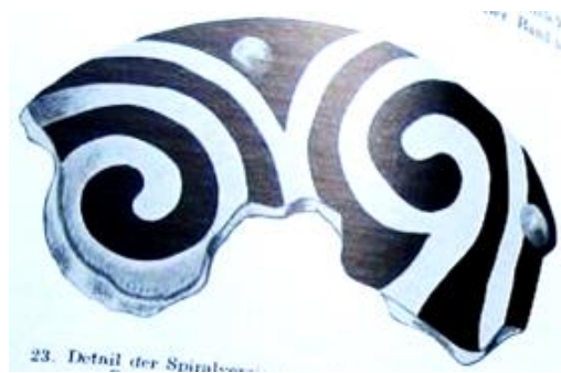
8-9. ábra. Zengővárkonyi tál és spirál. (Forrás: Dombay János: Die Siedlung und das Gräberfeld in Zengővárkony – Beiträge zur Kultur des Aeneolithikums in Ungarn (A zengővárkonyi település és temető. Adalékok az újkőkor kultúrájához Magyarországon). Archeologica Hungarica Series Nova XXXVII. Akadémiai Kiadó, Budapest, 1960. https://www.vatera.hu/dombay-janos-die-siedlung-und-das-gra-uml-berfeld-in-zengovarkony. )

Negyedszer: az a társadalom már meglehetősen tagolt lehetett. Nem csinált mindenki mindent, amire az embereknek szüksége volt. Volt, aki csak vadászott, volt aki csak kőbaltákat csiszolt és fűrt, volt aki pengéket pattintott (nem feltétlenül a kőbaltás), volt aki kultikus dolgokkal beszélte tele az emberek fejét és volt a fazekas. Persze, hogy figyelték a Nap járását, az évszakok váltakozását, hiszen arra szüksége volt a mezőgazdaságuknak, amit már vidáman üztek. De a fazekas nem volt azonos a csillagászukkal, vagy a meteorológusukkal, tehát eszébe se juthatott, hogy ékítményébe „kódolja” a csillagász (esetleg titkos!) ismereteit! Mint ahogy ma például van olyan szakember, aki vécéfedelek díszes változatait tervezi, de eszébe se jut valamelyik fedelére ráírni az ősrobbanás-elmélet vélt bizonyítékait.