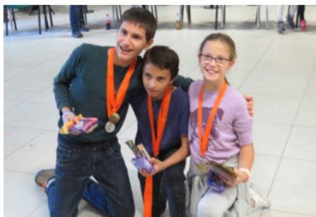
Sportversenyek egyik fordulójának nyertesei