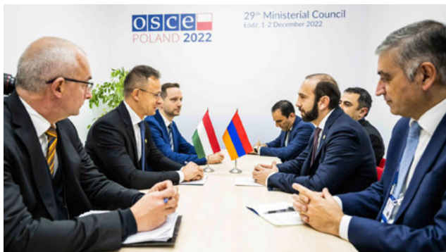
Szijjártó Péter a lengyelországi Lodzban tárgyal Ararat Mirzoján örmény külügyminiszterrel