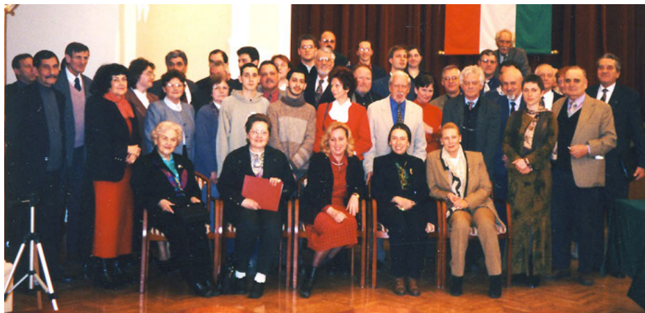
Az Erdélyi Örmény Gyökerek Kulturális Egyesület megválasztott képviselői a Városházán

A választás kimenetele azon múltott, hogy ellenfeleink nagyon sok új vidéki városban, faluban indítottak jelöltek, ahol korábban nyoma sem volt örményeknek. Ez a következő - 2014 évi -