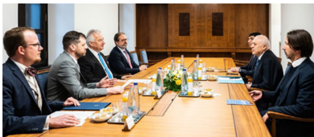
Semjén Zsolt miniszterelnök-helyettes fogadta Ashot Smbatyan az Örmény Köztársaság georgiai nagykövétét