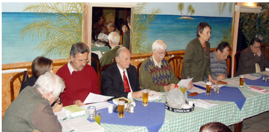
A képviselőjelöltek felkészítése az önkormányzati választásokra

arányában válasszuk meg, lesöpörték. A nyertes mindent visz alapon az EÖGYKE egyetlen képviselője sem jutott be az Országos Örmény Önkormányzatba. A Fővárosi Örmény Önkormányzat megválasztásához egyik félnek sem lett meg az abszolút többsége, de megvolt a lehetősége, hogy nem megjelenéssel a választást blokkolja. A választást mindkét fél blokkolta. A Fővárosi Örmény Önkormányzati választásnál mindkét fél a közelben készenlétben várakozott és csak delegáltakat, megfigyelőket küldött. Ebben a ciklusban nem alakult Fővárosi Örmény Önkormányzat. Az Erdélyi Örmény Gyökerek Kulturális Egyesületnek volt négy tiszta (egy jelölőszervezet képviselőből álló) budapesti kerülete, amely társulást hozott létre, Budapesti Örmény Kisebbségi Önkormányzatok Társulása (BÖKÖT) névvel. A BÖKÖT a ciklus alatt átvette a FÖÖ munkáját. Érdekes módon a politikai környezet is elismerte, mint a fővárosi örmények egyetlen hivatalos szervezete. A négy kerület a saját költségvetési összegének felét közös kosárba tette és azzal gazdálkodva igen jelentős rendezvényeket szervezett.