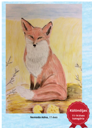
Nemoda Adna, 11 éves