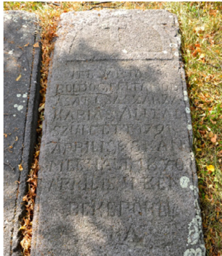
Császár Zakariás Antal sírköve Csíkszépvízen

De van, amelyik arról is mesél, hogy itt még történni fog valami: „ Itt várja boldog feltámadását Császár Zakariás Antal született 1791 április 28-kán, meghalt 1870 április 14-kén, béke poraira ”