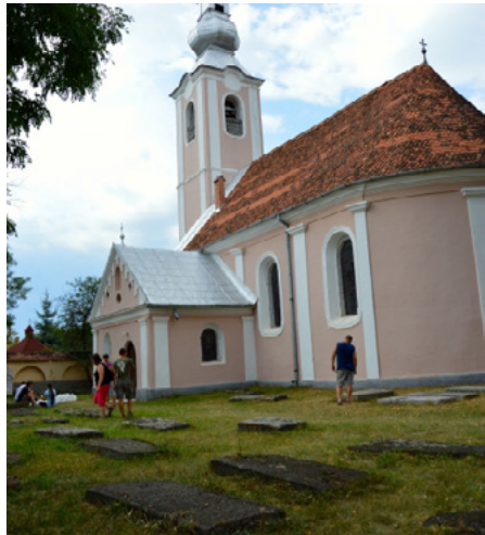
Csíkszépvíz, apró örmény temető az örmény katolikus templom körül

Pár évvel ezelőtt volt szerencsém sok év után újra Erdély földjén járni, túrázni és barátaink jóvoltából, türelméből, felkeresni a számomra fontos helyeket, temetőket, ahol még mesélnek a sírok is, az ősökről. Csíkszépvíz, Gyimesbükk, Kézdivásárhely, ahol a legtöbben, s a legtöbbet éltek ők, akik közül sokakat még fényképen szerencsére láthatunk, tudunk néhány érdekes vagy éppen hétköznapi dolgot az életükről. A temetőben, a sírjaik előtt állva mégis összekapcsolódik mindez, a fénykép, a néhány ismert dolog és az, hogy néhány méterre alant ott