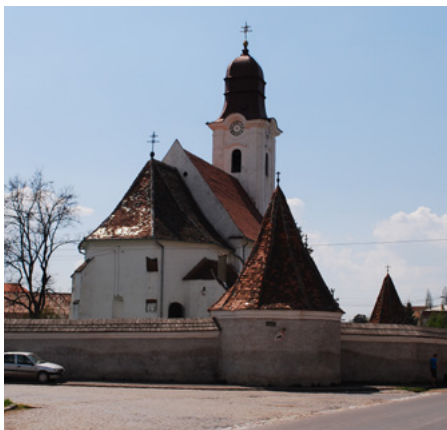
Gyergyószentmiklósi Örmény Katolikus Templom