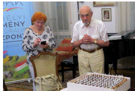
Születésnap köszöntés 90 gyertyával

Jó egészséget és további hosszú éveket kíván a Szongoth család a Magyarországi örmények nevében is!