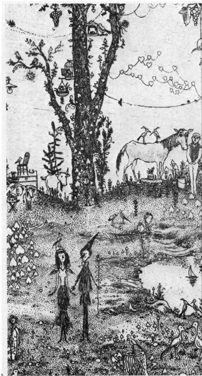
Gross Arnold: Az öröm ünnepe (1964, rézkarc, részlet)

aratott nagy sikert. 75. születésnapja környékén a Nemzeti Galéria raktárából előkerültek az 1960-as években készült lemezek, nyomóformák, így nemcsak a képeket, hanem az áthúzott lemezeket is kiállíthatta, amikről a rézkarcok készültek. Még egy utolsó nyomat készült róluk, és Gross Arnold rászoruló családoknak ajánlotta fel a képeket a Máltai Szeretetszolgálat és Kozmata segítségével. Persze, mert mindennap álmodik egy mesét. Aurája őriz valamit a béke hangulatából, és visszakapunk tőle valamit a mesék világából, a gyerekek ártatlanságából és az álmokból, amiket elmulasztottunk megőrizni.