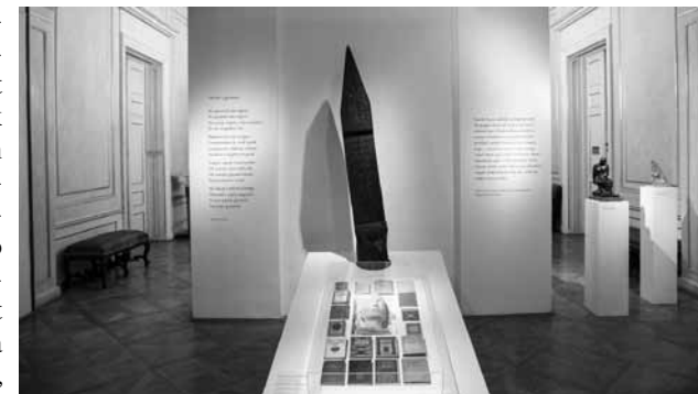
A régi csónakos fejfa