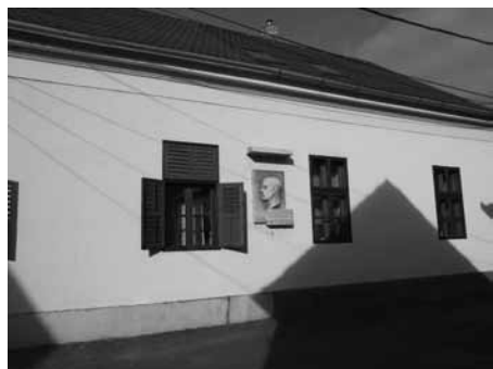
Keszthely, Kacsóh Pongrác utca, ahol a János Vitéz megszületett

Budapestre költözött, és 1898-tól matematika–fizika szakos gimnáziumi tanárként főleg matematikai cikkeket publikált. Érdeklődése azonban egyre inkább a zene felé fordult, később komponálni kezdett, elmélyedt a zeneelmélet tudo-