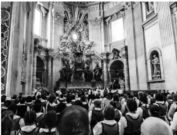
A Szent Péter-bazilikában Magyarok Nagyasszonya ünnepén