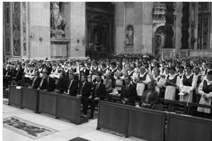
Székelyek Rómában. Hangsúlyos jelenlét

Szent Ignác-templomban. Tegnap, a Magyarok Nagyasszonya búcsú-ünnepén – amely a Szent Péter-bazilika altemplomában található Magyarok Nagyasszonya magyar ká-