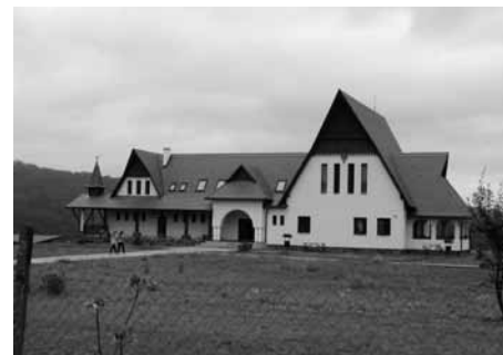
A szováta Marianum-ház

A harmadik nap a kirándulás/túrázós nap volt, mégpedig Wass Albert és legszebb legismertebb regénye, a Funtinelli boszorkány nyomában: a néhány vállalkozó kedvű és jó fizikai állapotban, a nehéz, meredek terepen túsára kész társunk felmászott az Isten székéhez, mi többiek szintén lelkesen a szép tájban gyönyörködve kirándulgattunk a Szalárd völgyében, ahol az egyik napsütötte tisztáson található a Bánffy forrás, egy természetes hőforrás, aminek kimélyített medrében fürödni lehetett. Semmihez sem hasonlítható élmény volt megmártózni az erdő övezte tisztáson a 26 fokos tiszta vízben. Nem lehet pontosan leírni azt az érzést sem, ahogy jártuk és láttuk azt a vidéket, amit Wass Albert olyan érzékletesen írt le