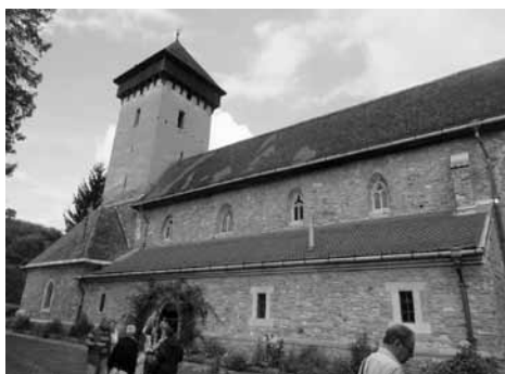
Almakerék – gótikus szász erődtemplom

hamvainak egy részét őrző, kősziklából készült síremlék is.