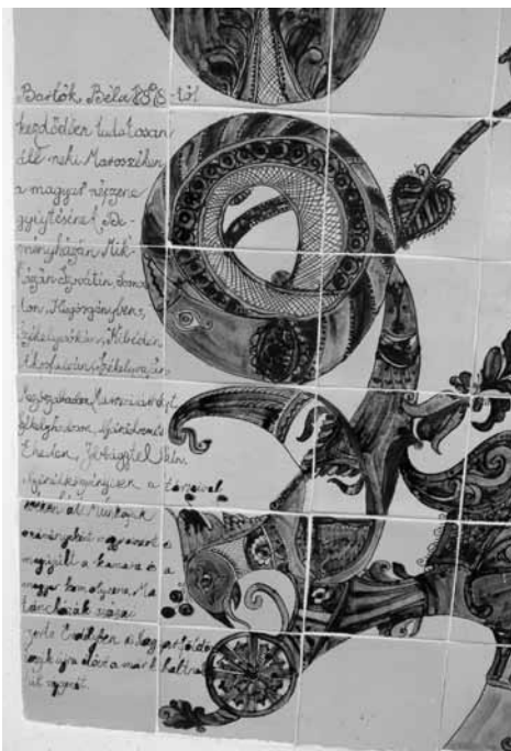
Jobbágytelke, Falumúzeum belső udvarán (kerámia)