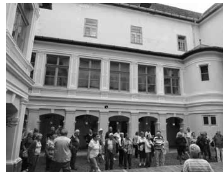
Marosvécs, a kastély belső udvara

A marosvécsi kastély meglátogatásával kezdődött az utunk „kastélyvonala”: annak vizsgálata, mit tehet és mit képes tenni a kastélyokat visszaperelő arisztokrácia, mi a felelősségük, mi a lehetőségük? Ezt a kérdéskört gondolhattuk tovább a következő, negyedik napon a keresdi Bethlen kastély meglátogatásával. A Bethlen család visszaszerezte a XV. században reneszánsz stílusban – először erődszerűen – épült kastély tulajdonjogát, azonban a teljesen kiürített, lecsupaszított épület helyrehozatala meghaladja