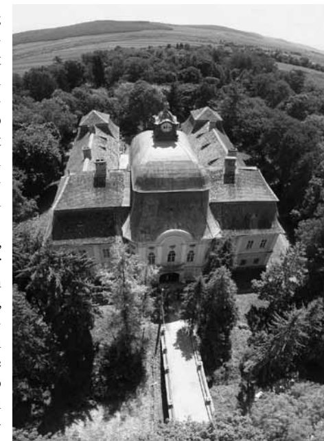
Teleki kastély, Gernyeszeg

A faluszéli dombon található Teleki kriptája meglepő látvány, jobban emlékeztet egy sátor tetős, ámbitusos falusi kúriához, mint nyughelyhez. Az építető a könyvtáralapító Teleki Sámuel gróf volt, aki felesége és fia: Domokos hirtelen halála miatt határozta el