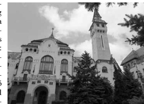
Marosvásárhely – Megyeháza (Cifrapalota)

Ugyanezen a napon, még a kastély meglátogatása előtt az első programpont Almakeréken a XIV. században az Apafi család által építtetett gótikus szász erődtemplom volt. Az először romanika stílusában épült zömök, mégis arányos templom a katolikus felekezethez tartozott, majd később gótikus stílusú evangélikus templom