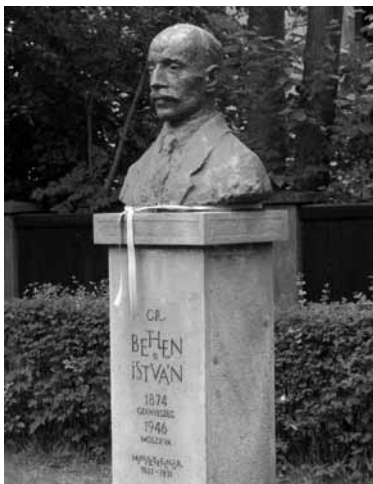
Gernyeszeg, Bethlen István szobra

A kastély parkja részleges pusztulása mellett is őrzi régi szépségét, hangulatát. Ebben a parkban zajlottak a helikoni írói találkozók nyaranta a két világháború között. E találkozók emlékéül tervezte Kós Károly a Helikon kőasztalt. A parkban található báró Kemény János és családja síremléke és ugyancsak a Wass Albert