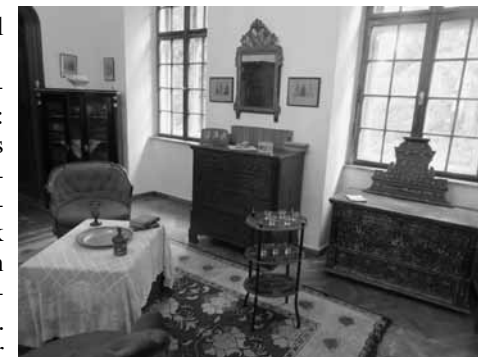
Gernyeszeg, a kastély enteriőre