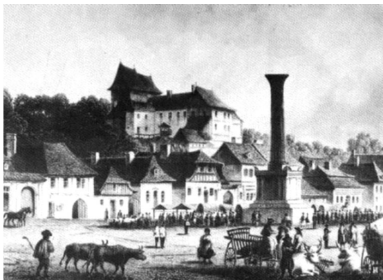
A 18. századi metszeten tökéletesen elkülönül a templom és kolostor képe a környező épületektől

(Forrás: Népújság , 2015. jun. 10., tallózta: Bálintné Kovács Júlia , képek: Bakó Zoltán Minoriták emlékei: Vendéglő áll a temető helyén, Székelyhon.ro )