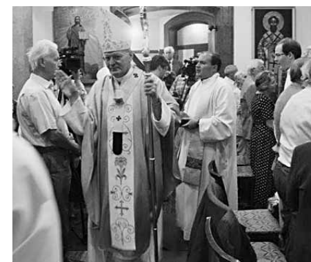
A bíboros úr a hívek között

A szentmise után a plébánia termeiben Dr. Erdő Péter bíboros úr köszöntésé-