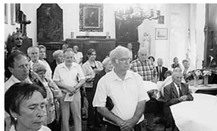
A zenesalon hallgatói