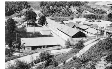
Kincstári aranyüző Verespatak-Torkán a vasút mellett