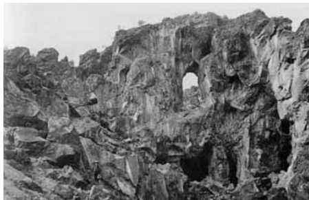
Nagycsetátyé római aranybánya