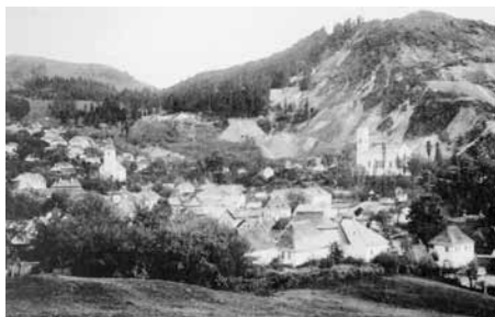
Verespatak látképe a Kirnyikkal háttérben

tetteknél sokkal nagyobb rablások voltak. Erről az időszakról már nincs családi emlékün, mert Budapestre áttelepült dédszüleimnek az erdélyi rokonsággal egykor volt kapcsolata addigra megszakadt. Mára az egykor Zalatnán élt erzsébetvárosi Lukácsok aranybányái a leszármazottak számára csupán keserűes emlékké váltak.