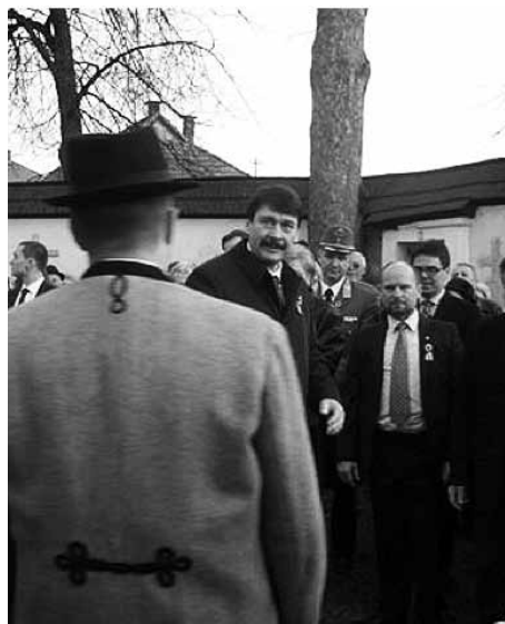
Áder János koszorút helyezett el Czetz János honvédtábornok emléklakettjénél