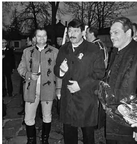
A helyi örmény asszonyok az örmények hagyományos édességével, dalauzival is megkínálták a vendégeket, az egyházfők, önkormányzati képviselők jelképes ajándékot adtak át a köztársasági elnöknek

Gyergyószentmiklósi látogatásának utolsó állomásaként a Petőfi- és Kossuth-szobor talapzatán helyezett el virágot Áder János. Hitvese, Hercegh Anita ez idő alatt a Szent Anna Otthonba látogatott, ugyanis a keresztstülő program keretében két, az otthonban nevelkedő kislányt támogatnak. Az esti órákban indult Kolozsvárra a küldöttség.