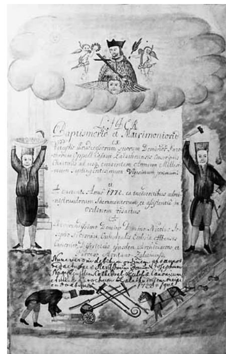
Az aranybányászat ábrázolása a zalatnai anyakönyvben