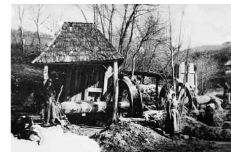
Egy hagyományos érczúzó kallómalom (Verespatak környéke, képeslap a Legendi család szívesességéből)

szerint bőven előforduló hegyi patakok vizét felduzzasztották és úgy szabályozták, hogy a vízhozam ne az időjárás szerint, hanem az ércfeldolgozás igényei szerint változzon. A víz erejével meghajtott malomkerék forgását a tengelyéből kiálló csapok révén az úgynevezett zúzónyilak megemelésére használták. A nyilak függőlegesen mozgó vasalt végű súlyos gerendák voltak, amik felemelkedésük után saját súlyuknál fogva hullottak alá, miáltal az aljuk juttatott ércrögöket kellően apróbb darabokra zúzták. A XIX. század közepén a Zalatnán átfolyó Vulkoj patak völgyében is több száz (!) zúzómű dohogott éjjel-nappal. Amint azt Jókai a „Szegény gazdagok”-ban írja (némi ironiával): „ A bányákat magánosok míveltetik, mindenfelé a patakok mentében egész sorozatait látni az ércztörőknek; egyik csinosabb, a másik rongyosabb, némelyiknek vagy vize nincs, vagy aranya, az nyugszik, a többi nagy gondolkodva hullatja kopogó kallóit, a völgyek oldalait századok óta felhordott kőhányások fedik, a mikben mind arany volt valaha. ” Máshol: „ az erdős hegyoldalakból távoli hámorok vérvörös fénye világít messze, s (a zúzó-művekből származó) gépies zörgés egyhangú kongása veri fel a csendet... ”