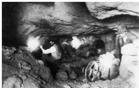
Bánya a XX. sz. elején (Képeslap a Legendi család gyűjteményéből)

Maga az ércbányászat (részben az ércnek viszonylag könnyű hozzáférhetősége miatt) a XIX. század elejéig középkori módszerekkel folyt: kézi erővel kivájt 9 , később esetleg puskaporral robbantott tárnákban. A meddő kőzet kibontása mind veszteséget jelent, 10 ezért az aranybányák vágatai a lehetőségek határáig szűkek és