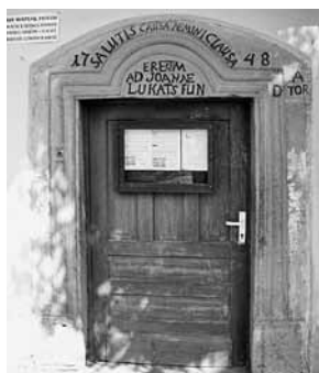
Az örmény templomkert kis-kapujának felirata