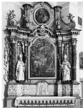
A gyergyószentmiklósi római katolikus templom északi mellékoltára, és rajta az erzsébetvárosi Lukácsok címere