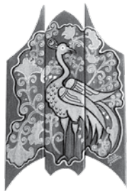
Csiki Margit Gitka örmény motívuma