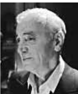
A 87 éves Charles Aznavour