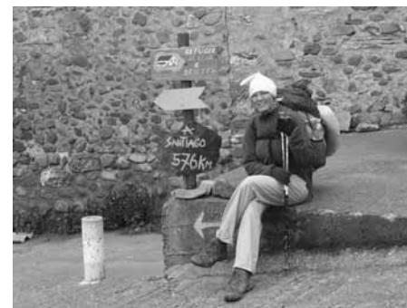
Már csak 576 kilométer...

Ez a zarándoklatok célja: önmagam számára meghalni és kinyitni magam egy Felsőbb dolognak, amelyet sokan Istennek hívnak. Ez az Erő és ez a Lélek formálja az embert minden lépésénél, és – ahogy az ismert történet is mondja – akkor fedezzük fel Istent leginkább, amikor a legmagányosabbnak érezzük magunkat. A történet szerint az ember a mennybe fölérve visszatekint az életére, ahol mindig négy lábnyomot lát: az övét és Istenét. Azonban a legnehezebb, legfájdalmasabb életrésznél csak egy pár lábnyom nyomait látja, és kérdőre vonja Istenét, miért hagyta magára? A válasz így hangzik: „ Nem hagytalak magadra. A karjaimban vittelek. ”