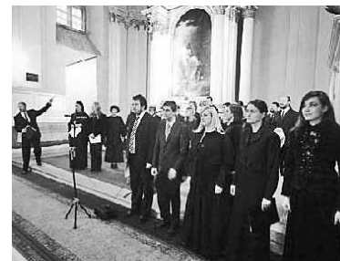
Fiatal, de megfelelő tapasztalattal rendelkező énekesek adták elő a művet