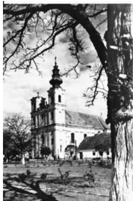
Az erzsébetvárosi örmény főtemplom