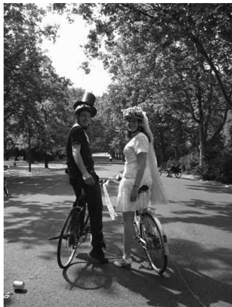
Kerékpáron a nagybetűs életbe

Úgy van velem, hogy itt hagyott magamra.”