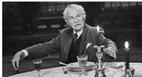
A gyertyák csonkig égnek című filmben

Örmény családból származott, amire mindig büszke is volt. Nagypapa az ör-