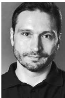
Bogdán Zsolt

Mert egyszerűen nagyon jó. Főszerepekben egyformán jó. Jó, ha szere-ti a szerepét, de ak-kor is jó, ha nem tud megbarátkozni vele. Mert mindent elsőprő szenvedéllyel ját-szik. Az ujjai köré csavarja közönségét.