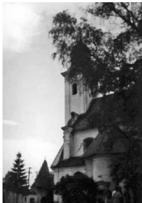
A gyergyószentmiklósi örmény katolikusok temploma

Székelyföld nem csak a vasútvonalat és néhány emlékművet köszönhet az olaszoknak. Egy itáliai hadmérnök, Luigi Ferdinando Marsigli (1658–1730) másolta és mentette meg az utókornak a harmadik legrégebbi rovásírás- emléket. A tudós grófort a kaland és a törökök elleni háború vonzotta Magyarországra. A Rába vonalát védte magyar katonák parancsnokaként, de török fogságba esett. Budavári raboskodása alatt feljegyzéseket készített a vár védelmi rendszeréről. A hagyomány úgy tartja, ennek segítségével sikerült Budát visszavenni a törököktől. Mindenesetre az tény, hogy miután magas váltságdíj ellenében kiszabadult, a császári csapatok tisztjeként vett részt Buda visszavételében, majd Erdélybe vezényelték. Marsigli bármerre került, nagy érdeklődéssel tanulmányozta a helyi természeti kincseket és a kultúrát. Székelyföldön feljegyzéseket készített az ottani emberek életéről, és akvarelleken meg is örökítette őket. Gyergyószárhegyen a Lázár-kastély mellett ferences kolostorban akadt a