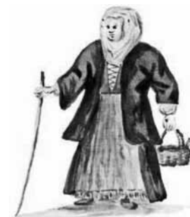
Csíki székely asszony, ahogy Marsigli látta

szolgáltak. A végleges kőépület már az alapító halála után, 1751-ben, a templom pedig 1727 és 1795 között készült el. Az iskola ma romokban van, a gimnáziumnak egy másik többszintes épület ad otthont, de a város szeretné egyházi segítséggel megmenteni, újjáépíteni az eredeti épületet.