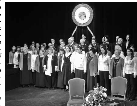
A budapesti Ciszterci Szent Imre templom kórusa és a nagybecskereki Emmanuel kamarakórus