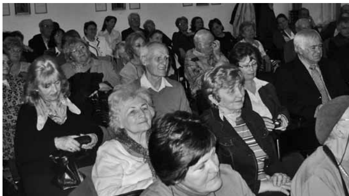
A márciusi klub közönsége

„Ilyen rendezvényünk még nem volt.” – Összegezte