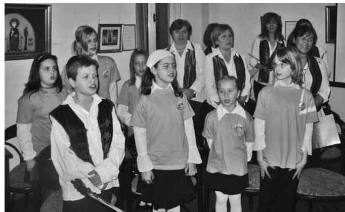
A Lemhényi Dezső Általános Iskola tanári- és gyermekkórusa

Március 15-re emlékeztünk ismét, amikor is a kórus elénekelt az Egressy Béni által megzenésített Talpra magyart, majd egy pár ismert Kosuth-nótát a klubest közönségével együtt. A kórus, a zenés barátok és a Tigrán együttes közösen megszólaltatta a Toborzódalt is, a Hány Jánosból.