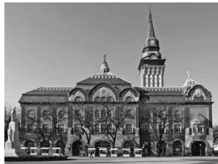
A szabadkai városháza