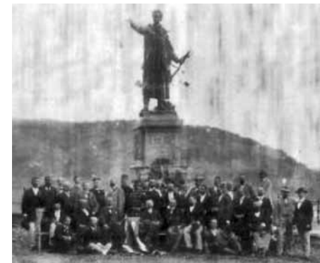
Az „újonnan” emelt Petőfi-szobor Segesvárnál