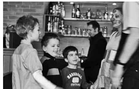
A gyereksereg és Zsuzsmó bohóc

A rajzok és színezésük érzékenységről, fantáziáról tanúskodnak. A gyöngyfüzések ékeskednek, sasok és vonatok száguldva repülnek, erdők és üvegre festett örmény zászlók vidáman pompázhatnak: itt mindenki jól érezte magát. Viszontlátásra! Cteszutjun! – így búcsúztunk, és az elfelejtett örmény