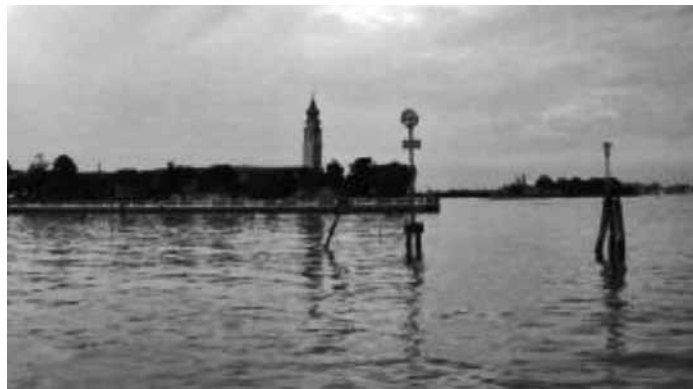
San Lazzaro szigete, amelyet a helyiek örmény szigetnek is neveznek

(Megjelent: Új Ember katolikus hetilap, 2005. jan. 16.)