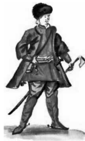
Székely katona az itáliai hadmérnök szemével

Guarini Bonaventura közbenjárása folytán XI. Ince pápa saját pénztárából évi