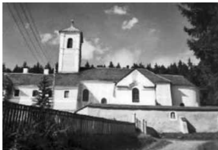
A ferences kolostor, amely egykor a rovásírás- emléket őrizte

tal és gyalog tették meg az utat falujukból Székelyföldre huszonnégy nap alatt. És bár hivatalos munkavállalásról volt szó, nem látták őket szívesen új otthonukban. A betelepülők vezetője a Bosin család volt, több vállalkozás mellett egy kőbánya tulajdonosa. A vasútépítésre szóló megbízás két évre szólt, de más felkéréseket is kaptak. Például kilencven százalékban ők szállították a Margit híd építéséhez a bazaltot, és ők emelték Segesvárnál Petőfi Sándor szobrát. Sok Predazzóból érkező család telepedett le végleg a Kárpáton túl, székely vagy román területen. Leszármazottaik, többek között a Gabrielli, a Kraighero, a Dzsákommellő vagy a Bosin család ma is ott él, és bár a nyelvet nem beszélik, olasznak vallják magukat. 1990