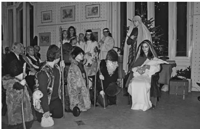
Szent Család Plébánia gyermek színjátszó köre