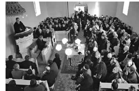
Ünnepi istentisztelet Ady Endre emlékére

pád házigazda lelkipásztor a 100. zsol-tár verseivel köszöntötte. Az ünnepség Ady Endre szülőházánál folytatódott. A fiatalság is szép számban képviseltette magát a megemlékezésen, hiszen négy református iskola: a zilahi, a váradai és a szatmári gimnáziumok mellett a debreceni Ady Endre Gimnázium küldöttsége vett részt az ünnepségen.