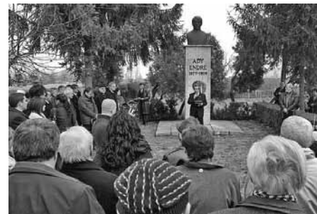
Ünnepség Ady szobránál