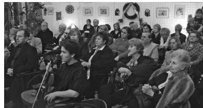
A decemberi klubdelután közönsége a Csontváry teremben

dott, népi jelleget öltött, népszokássá vált. De a faluban, amikor házról-házra jártak, nem lehetett minden jelenetet előadni időhiány miatt, hiszen sohasem értek volna a végére, ezért egy-egy mozzanatot tanultak be és adtak elő egy-egy háznál. Így egy-egy betlehemes öt-hat perces volt. Egyik háznál a pásztor