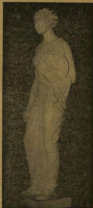
A film alegóriája.