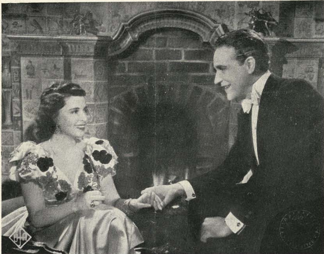
Jelenet a Feleség c. filmből.