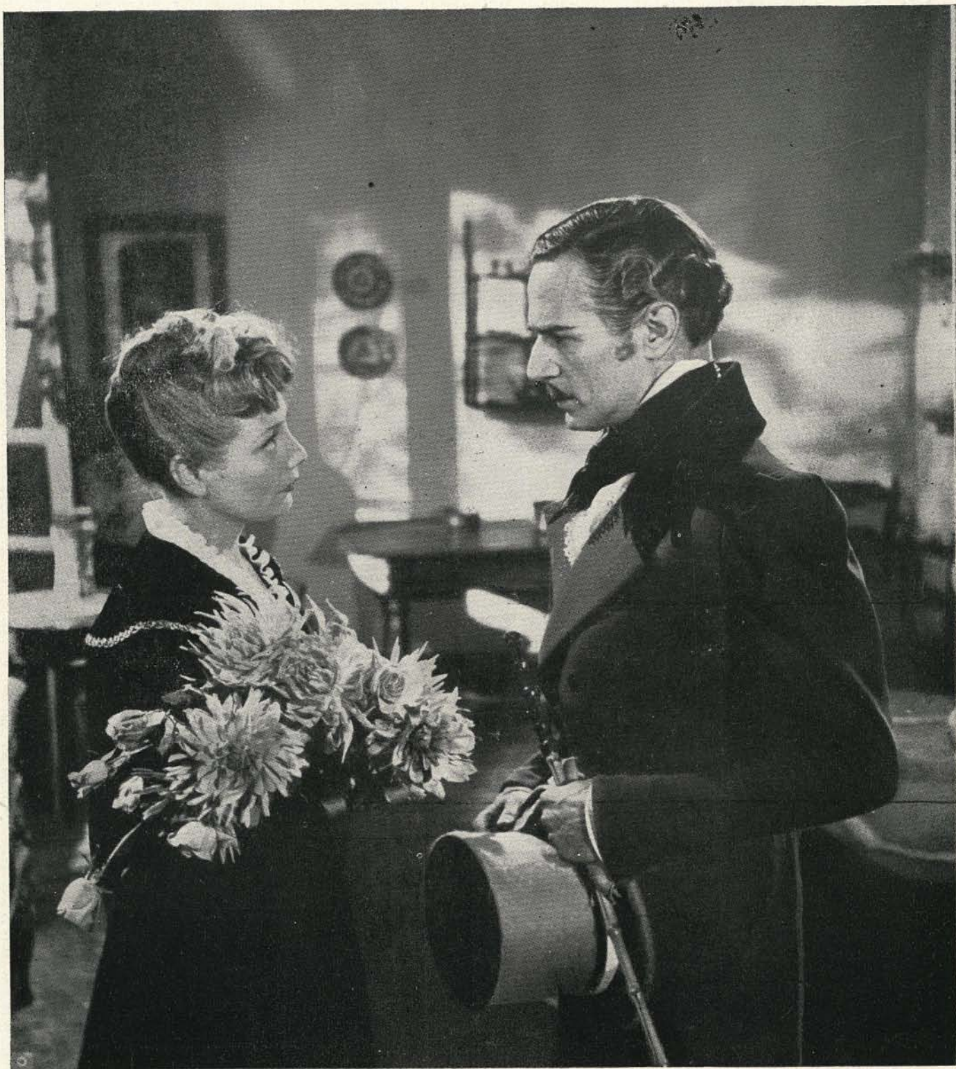
Jelenet a Gróf Monte Christó c.-filmből. (Siker-film.)