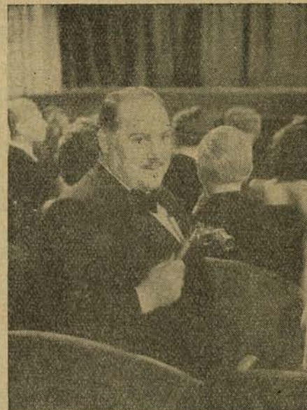
Will Dohm legújabb szerepében a »Kivirul az öreg szíve« c. Jannings-filmben.