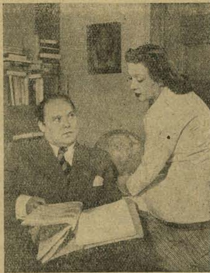
Vajjon milyen érdekességet rejt a következő közös film forgatókönyve?