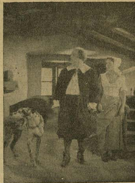
A bős polgármester és bájos felesége.