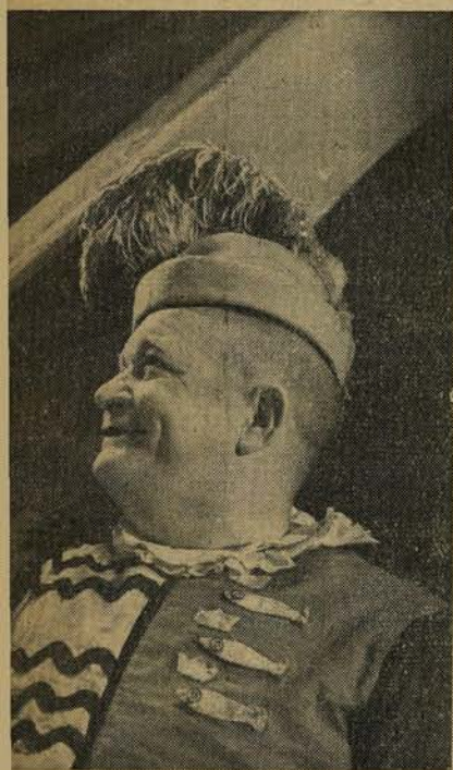
U Eredeti Zoro-Huru-film, 1941-es produkció!