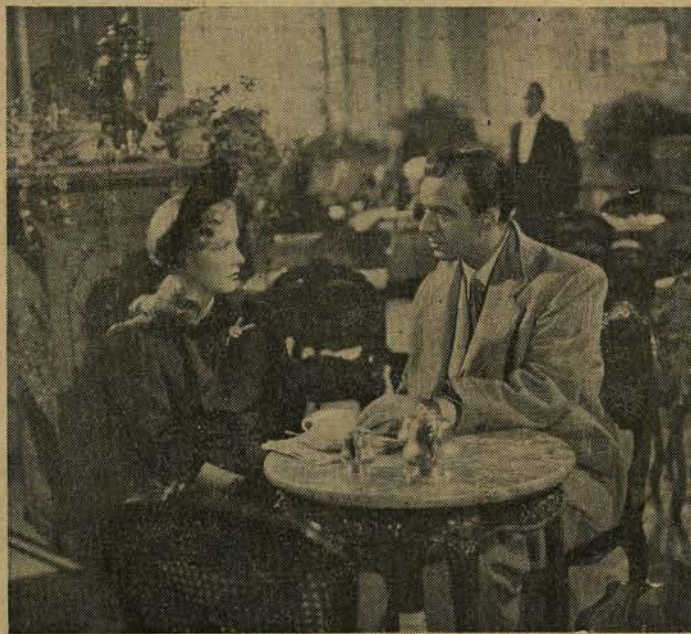
Jelenet a »Lezárt ajkak« című Esperia filmből