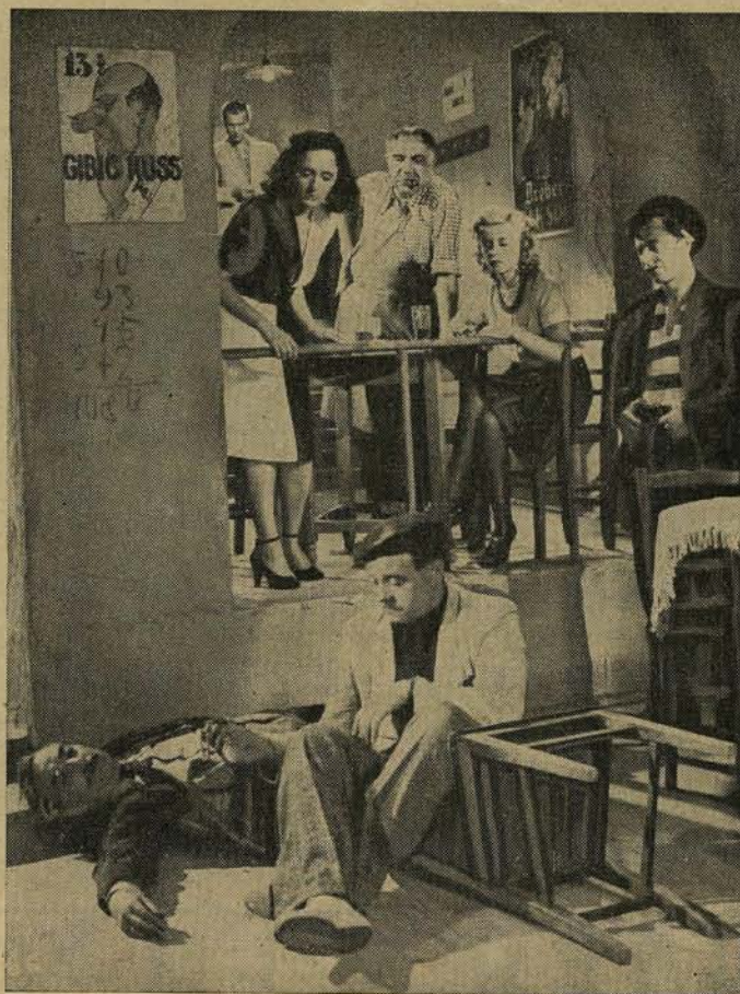
A „Külvárosi órszoba“ egyik érdekes jelenete.