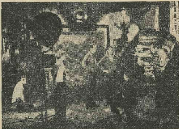
Felvétel háttérvetítés segítségével egy amerikai filmműteremben.

Egy amerikai szaklap, a Journ. Soc. Mot. Pict. Eng. 1938. májusi száma egy szürke és színes felvételekre egyaránt használható mozgó és dia háttérvetítő berendezés leírását közli. A fényforrás Hall & Conolly-féle ívlámpa 13.6 mm átmérőjű szennel, 200 A erősségű árammal tartható üzemben. A berendezés fontosabb tartozékai: a tökéletes vetítést biztosító aszférikus kondenzor, diaposzitiv tartó (4x5 coll-ig), 160 mm gyújtótávolságú objektív és léghűtés minden könnyen melegedő alkatrész számára.