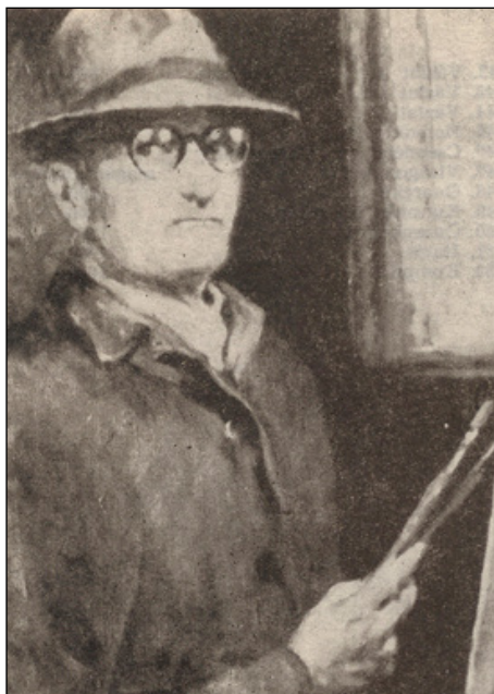
Önarckép