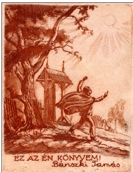
Bánszki Tamás grafikai

(OSZK Térkép-, Plakát- és Képzőművészeti Múzeum – Raktári jelzet: Exl.K/82 ; Exl.B/203)