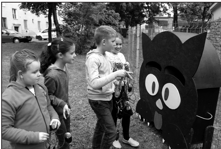
A Kaffka Könyvtár Fekete Macskája

Ezt az alkalmat emlékeztetéssé kívántuk tenni azzal is, hogy ezen a rendezvényen adományoztuk oda először az Év Olvasója-díjunkt gyermek és felnőtt kategóriában, és itt adtuk át az elismeréseket A Kaffka Könyvtár Fekete Macskája , azaz Hozd el neki az egered! akció helyezettjeinek is.