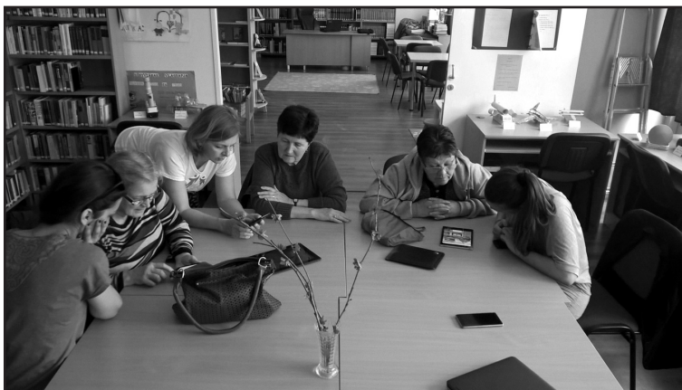
DigiNagyi a könyvtárban