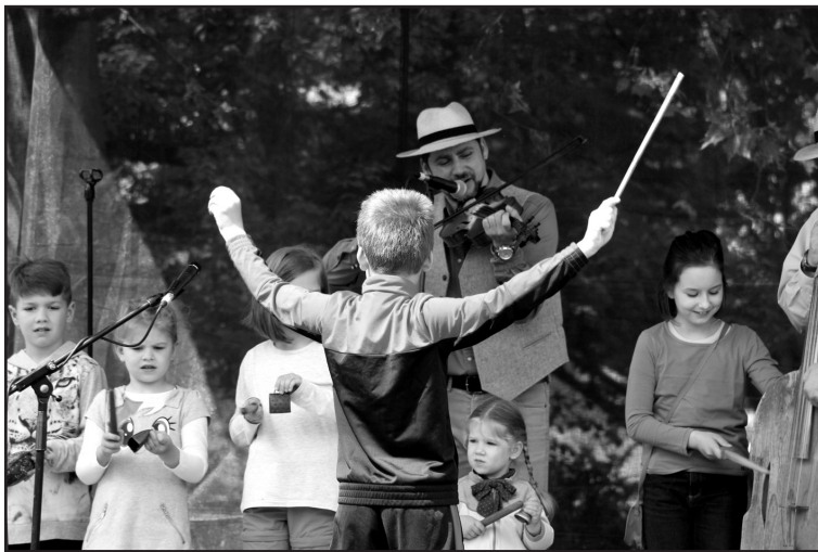
A színpadon a Kolompos együttes

A majálisok sikerét az őszinte gyermeki kérdések bizonyítják. A gyermekkönyvtárba látogatók már most kérdezik: ugye lesz ebben az évben is majális?