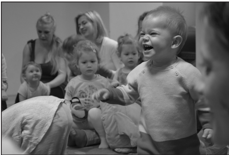
Katica babajátzó

A Ceglédi Városi Könyvtárba járó emberek – legyenek azok gyerekek, édesanyák, édesapák, nagymamák vagy nagypapák – a gyermekkönyvtári közösség tagjai. A könyvtár szolgáltatásaival és programjaival ezt az összetartozást erősíti, ahol nemcsak a gyerekek fontosak, hanem a család minden tagja. A gyermekkönyvtár egy olyan hely, amely a ceglédi és a környékbeli családok sok problémájára megoldást kínál. Olyan hely, melynek révén közösségek, barátságok szövődhetnek. Családias hangulat, tiszta és rendezett környezet, segítőkész könyvtárosok várják az olvasókat.