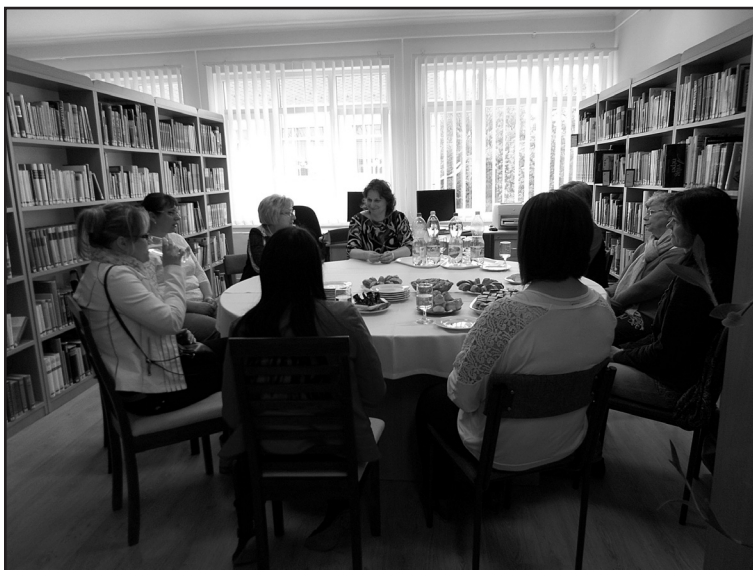
Könyvékbeli Könyvtárosok Találkozója, Mezőkeresztes

Úgy gondolom, az ebben a kis körben megvalósított összejövetel mindannyiunk számára meghatározó volt, eredményeinket, a kulturális intézmények ismertségét és elismerését, a helyi társadalmi problémák megvitatását célzó közösségi találkozó pozitív visszajelzésekkel zárult. Reméljük, hogy a jövőben is meg tudjuk tartani e kezdeményezésünket, amely kiváló mód arra, hogy a könyvtárak által közvetített lehetőségeket, jó gyakorlatokat, szellemi javakat mindannyian továbbvigyük és felhasználjuk a célcsoportok támogatása érdekében.