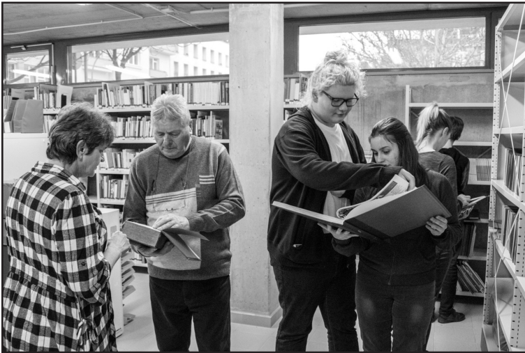
Pincétől a padlásig. Családok a tömörraktárakban – Fotó: MZSK 3

A Móricz Zsigmond Megyei és Városi Könyvtár dolgozói pedig a programok résztvevőinek ezen a héten könyvtári sétán mutatták be az intézményüket – a pincétől a padlásig. A Pincétől a padlásig elnevezésű programot 2005-ben, az újjáépült könyvtárban indították útjára, először csak szervezett gyerekcsoportoknak, könyvtárbemutató foglalkozás keretében. Mivel a családokat is szerették volna még jobban bevonni a könyvtárba és a könyvtári rendezvényekbe, csatlakozott a könyvtár a Múzeumok Éjszakája programhoz, és családok részére szervezett Kalandoz Kardok című könyvtári kalandtúrát, a Nyíregyházi Magyar Szablyavívó Iskolával közösen. Amellett, hogy játékos formában kipróbálhatták a szablyavívást, vetélkedőn vettek részt, a program része volt, hogy a család tagjai, gyerekek, felnőttek közösen minden órában könyvtáros vezetésével körbejárhatták az épületet, a pincétől a padlásig.