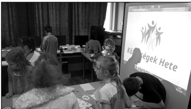
Könyvtármozdi Plusz 2017