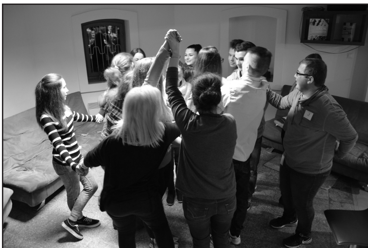
Tekeredik a kékgyő az ifi-ben – Fotó: Jeneiné Ecséri Mariann

A játékok a kikapcsolódás, szórakoztatás mellett a fejlesztést és ismeretszerzést is szolgálják. A Gazdálkodj okosan társasjáték arra tanít, hogyan kell takarékoskodni, pénzt beosztani. A játék során sok olyan helyzet adódott, amikor a fiataloknak rá kellett döbenniük, nem is olyan egyszerű önmagunkat vagy családunkat eltartani. Nekünk, könyvtárosoknak is tanulságos volt, mert nem gondoltuk, hogy mennyi mindennel nincsenek tisztában a fiatalok, vagy hiányosak az ismereteik, mint pl. hogyan fizetünk be csekket, mi mindenért fizetünk havonta, mi létfontosságú és mi nem. Bebizonyosodott számunkra, hogy a játék hatékony módja annak, hogy ismereteket adjunk át fiataljaink számára a hétköznapi élet dolgairól is.