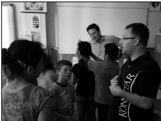
Érdeklődő tekintetek Csapiban

még napokkal később is emlegették a látottakat. Csapiban például meglepve tapasztaltuk, hogy a pedagógus azzal kezdte az órát, aminek keretében előadást tartottunk, hogy belülről kulcsra zárta az ajtót, hogy a gyerekek az óra alatt nehoj kimenjenek. Ehhez képest az óra végén, amikor már szabadon elmehettek volna, mégis maradtak, érdeklődtek, kérdeztek tőlünk, és kíváncsian lapozták a könyveket, melyeket magunkkal hoztunk. Ez számunkra is nagyon sokat jelentett.