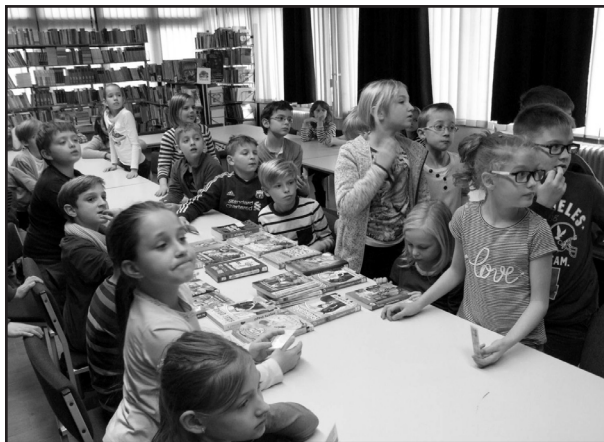
Akikért érdemes csinálni

Számomra megkérdőjelezhetetlen a pedagógus szerepe és felelőssége az olvasás terén, mi csak segítő kezet tudunk nyújtani, de azt nagyon szívesen tesszük. Nagyon ideillik az egyik tanárnő gondolata is: „Egy gyereknek azt kell olvasnia, amit szeret. Mindegy, hogy mit olvas, csak élvezze.” Ennek a gondolatnak a kiteljesítésében nem is tudok alkalmasabb partnereket elképzelni, mint a könyvtárakat, hát élünk ezzel a lehetőséggel!