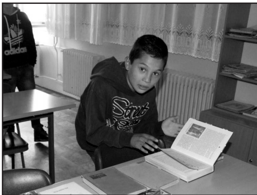
Galamboki iskola. Előadás végén szabad nézegetni

Az iskola és a közkönyvtár együttműködése tehát igen sokrétű lehet, és mindkét fél számára sok eredménnyel kecsegtető lehetőséget jelent. Nem kell ennek érdekében mást tennünk, csupán meghallgatni a másik felet, odafigyelni egymásra. Egy közös gondolkodásmód révén a fennálló, sokszor nem túl rózsás körülményekből viszonylag kevés anyagi ráfordítás mellett meglepő eredmények elérése lehetünk képesek.