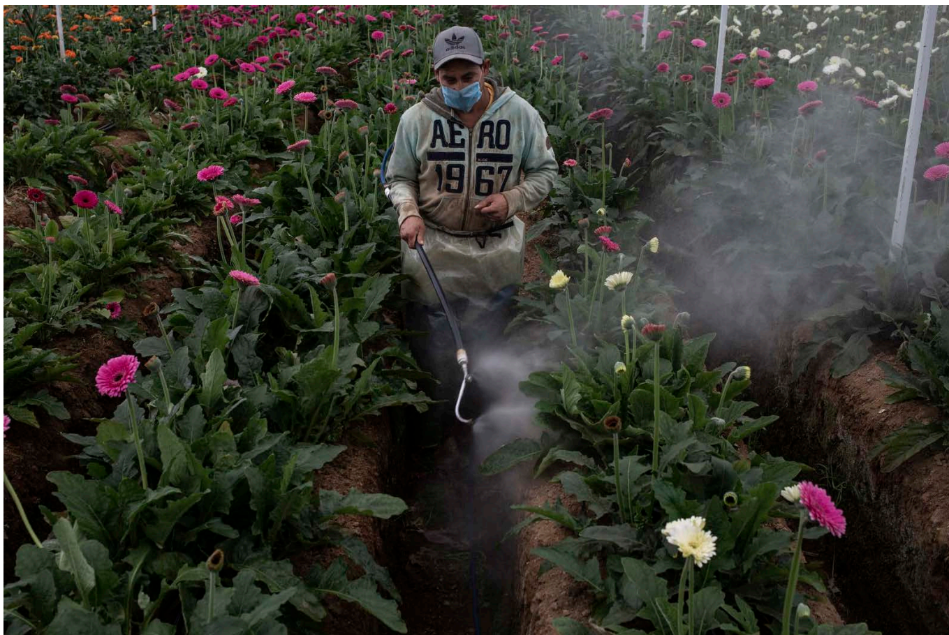
Egy munkás gerberákat szór be vegyszerrel egy Villa Guerrero-i üvegházban, Mexikóban, 2020. március 21-én.

A kertészet alkalmaz mindenkit Villa Guerreróban, híresek vagyunk a virágainkról, messze földről ide jönnek vásárolni, ha szép csokrot akarnak vagy ha esküvőt szerveznek. Szeretem az esküvőket, jó látni a fiatalokat, ahogy egy új életre készülnek, az Úr elé járulnak, fogadalmat tesznek, hogy kitartanak egymás mellett jóban-rosszban, egészségben-betegségben. Ilyenkor az egész templom virágba borul, a menyasszony hajában hófehér liliomkoszorú, a kezében gerberacsokor. Nálunk a virágok sokáig bírják, nem kókadnak le a melegben, szép marad a templom, hetekig akár, és otthon, a nászágy mellé szoktuk letenni a menyasszonyi csokrot, hogy díszítse a helyet, ahol majd az új élet fogan.