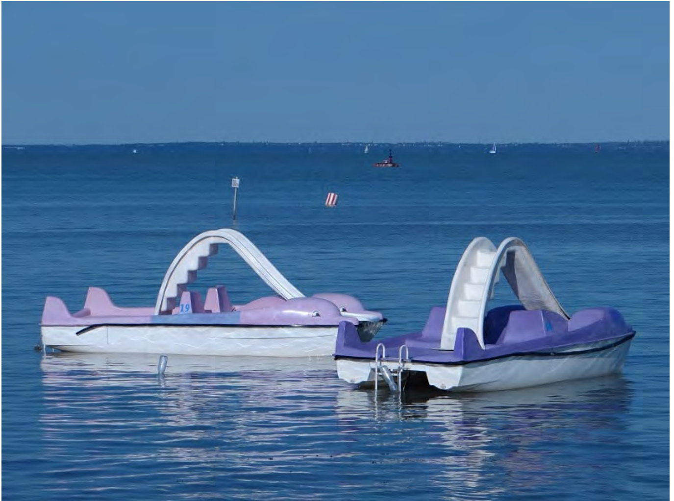
Balázs Szántó, flickr.com

– Rohadj meg, te ratyi! – koppant a lány hangja a nyakszirtjén. Nem reagált, ment tovább.