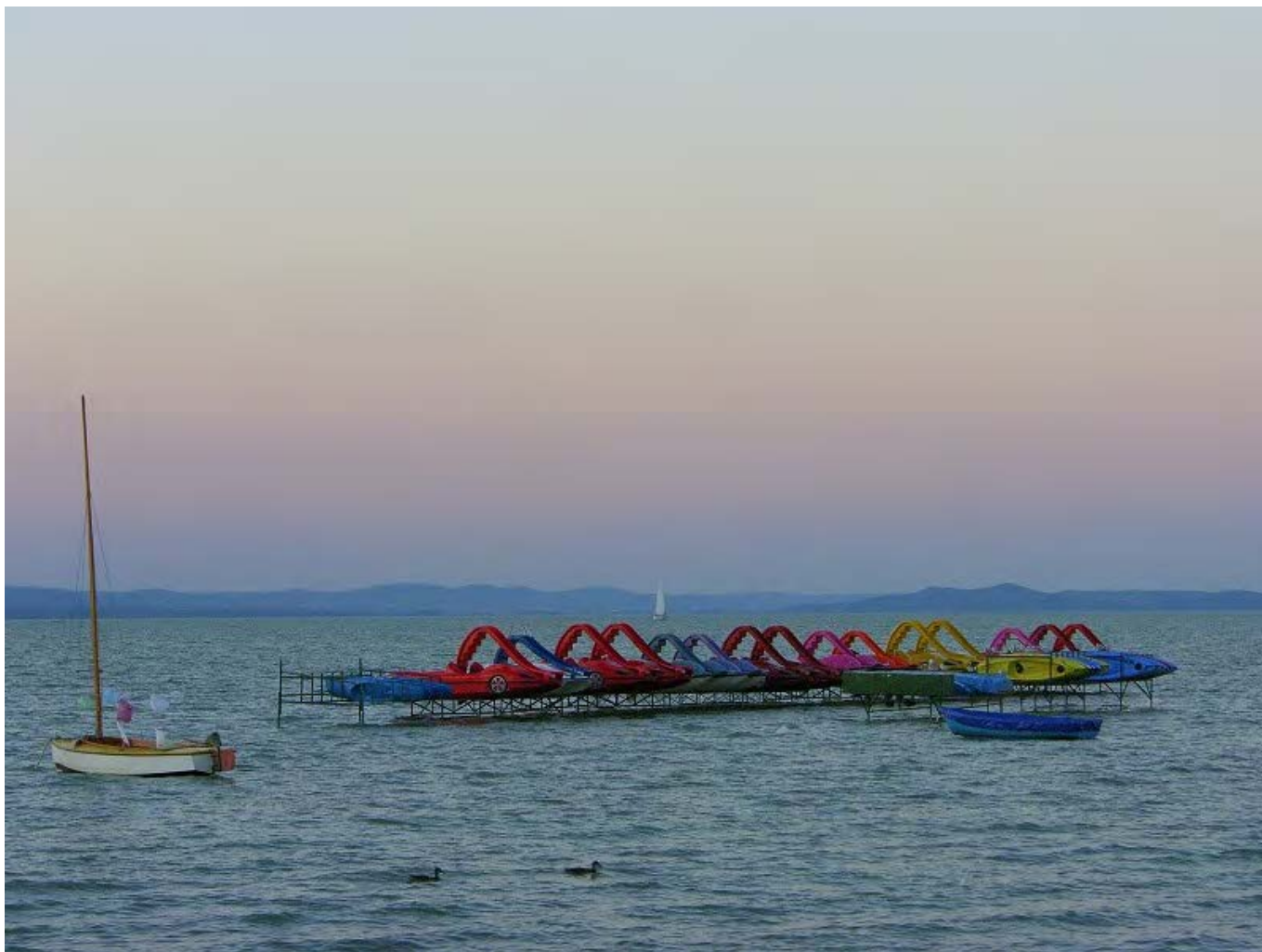
Krisztina Konczos, flickr.com