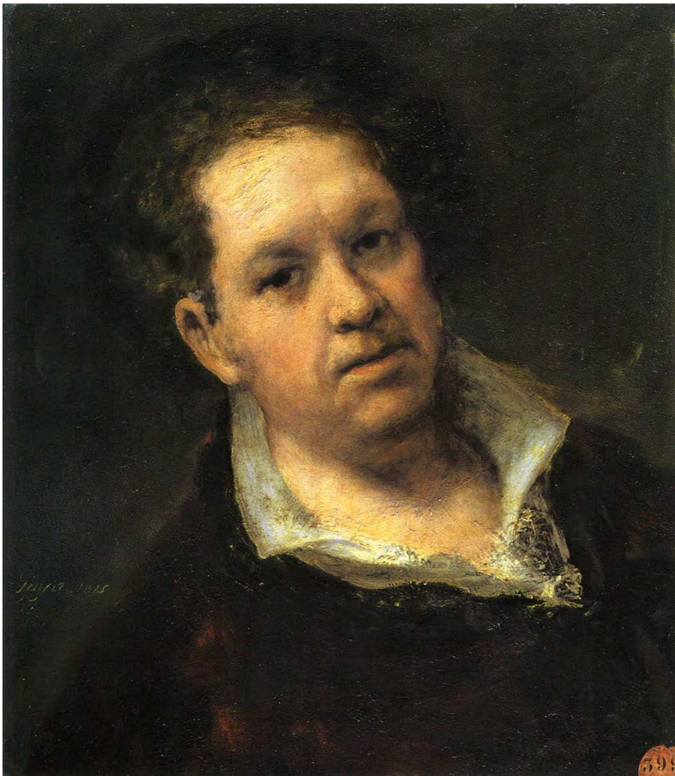
Önarckép 69 évesen

1819-ben újabb hosszantartó, súlyos betegségben szenvedett, de barátja, Arrieta doktor gondos, kitartó ápolásának köszönhetően életben maradt. 73 éves. Megvásárolta Madrid közelében a Quinta del Sordót (A süket házát) és 1820–23 között