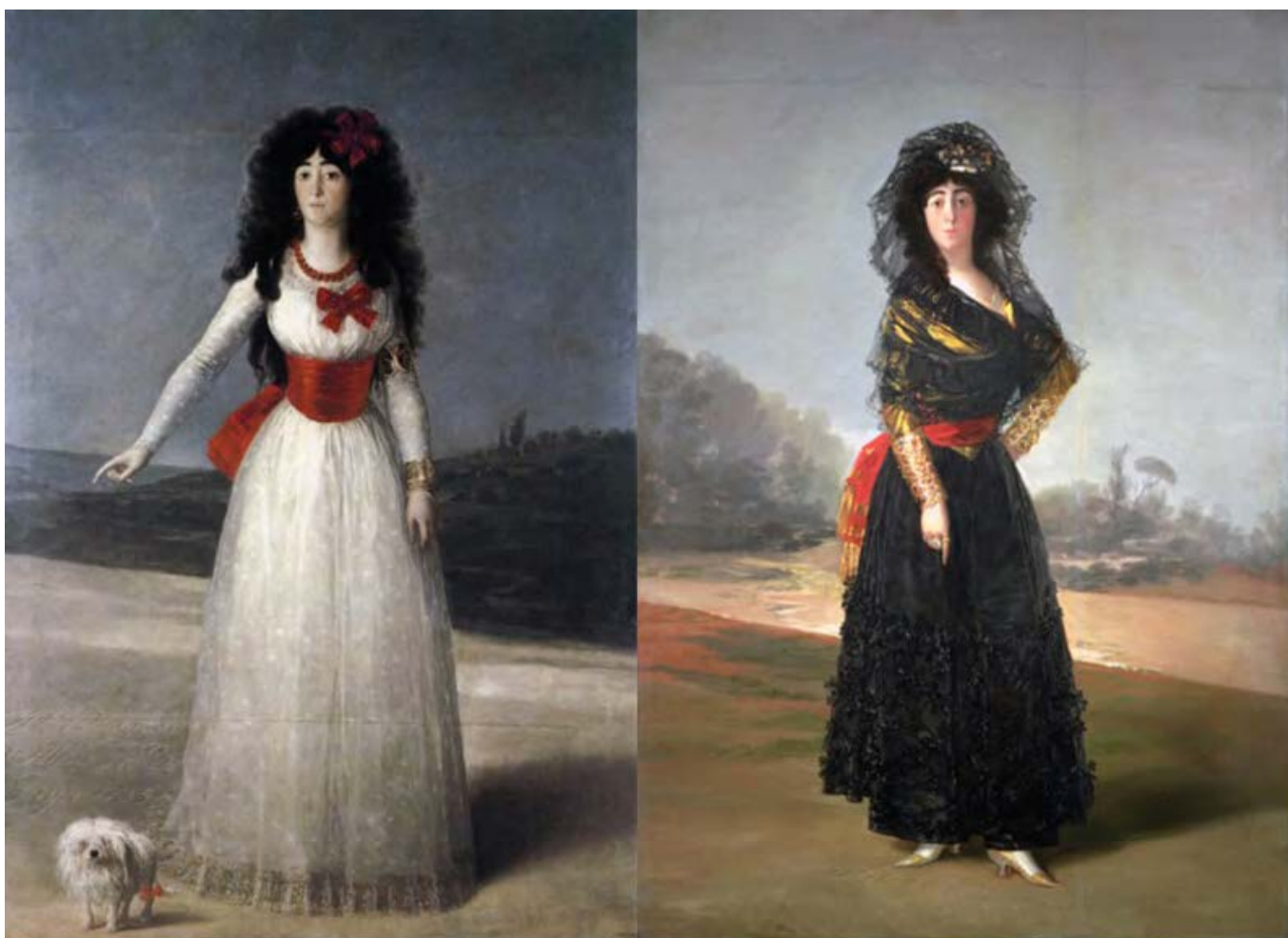
Alba grófnő fehérben; Alba grófnő feketében

forrásból és belülről is megvilágította. Depresszív állapotából az idősödő férfit a nála jóval fiatalabb Alba grófnő iránti szerelem mentette ki. 1795-ben ismerkedtek meg, a mecénás férj rendelt portrékat feleségéről. Goya szenvedélyes szerelemre lobbant, gyakran találkoztak, a festőről szóló életrajzi regények és filmek biztosra veszik, hogy a vonzó külsejű nő Goya szeretője volt (erről a két ragyogó, egész alakos kompozíció nem árulkodik: Alba grófnő fehérben , Alba grófnő feketében ). Ugyancsak 1795 és 1797 között készültek azok a szembenéző, torzonborz hajú tus önarcképek, amelyeket a Goyáról írók leggyakrabban reprodukálnak. Betegsége miatt kevesebbet fest. Megrendelés nélkül készült kisméretű képeinek témája is lidércnyomásos ( Boszorkányok a levegőben , Tűzvész , Az őrültek háza ). 1797–98-as 80 nyomatból álló rézkarc és aquatinta sorozata, a Los Caprichos különös erejű társadalomkritika. Ahogy ő fogalmaz egyik levelében: „Az emberi tévedések, bűnök, különbségek és balgaságok kritikája”.