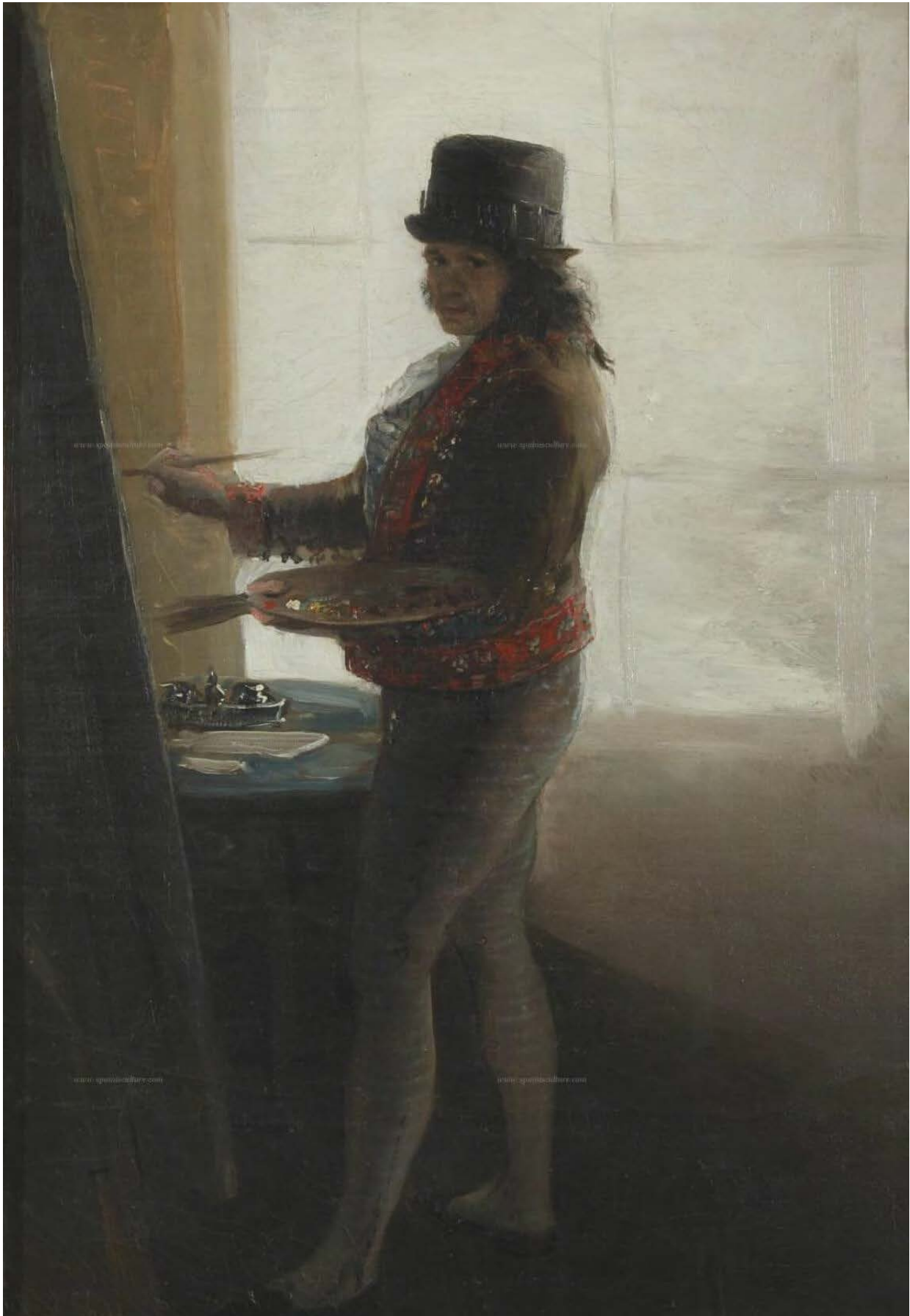
Önarckép a festőállványnál