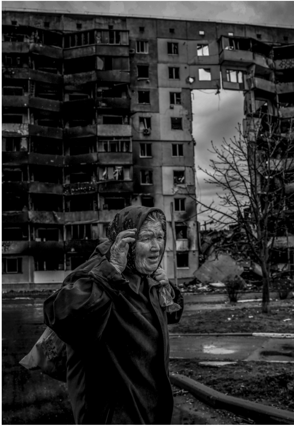
Husztli István: Borogyanka, Szilánkok-sorozat, 2022 (Képriport, MÚOSZ nagydíj, 1. helyezett)