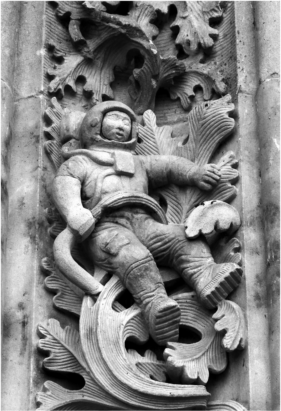
Salamanca, Catedral Nueva