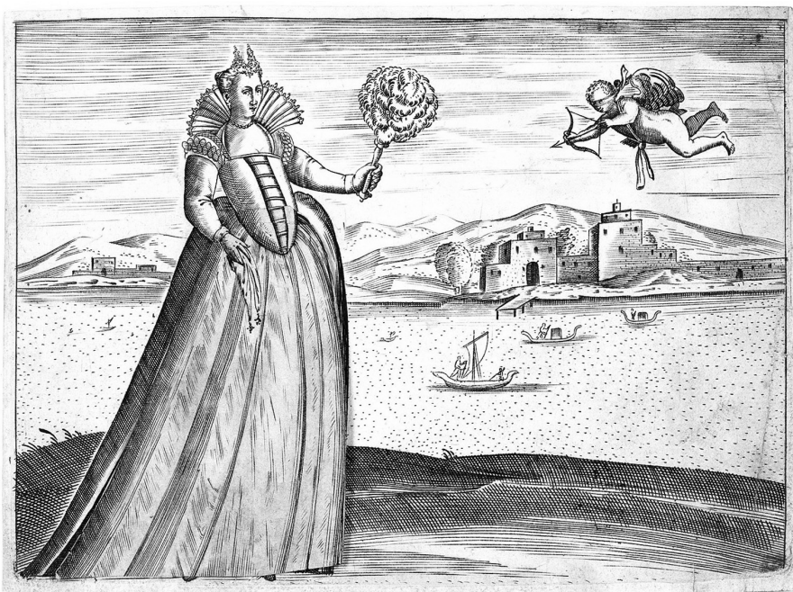
Ferrando Bertelli: Velencei nő felhajtható szoknyával, 1563 (Metropolitan Museum, New York)