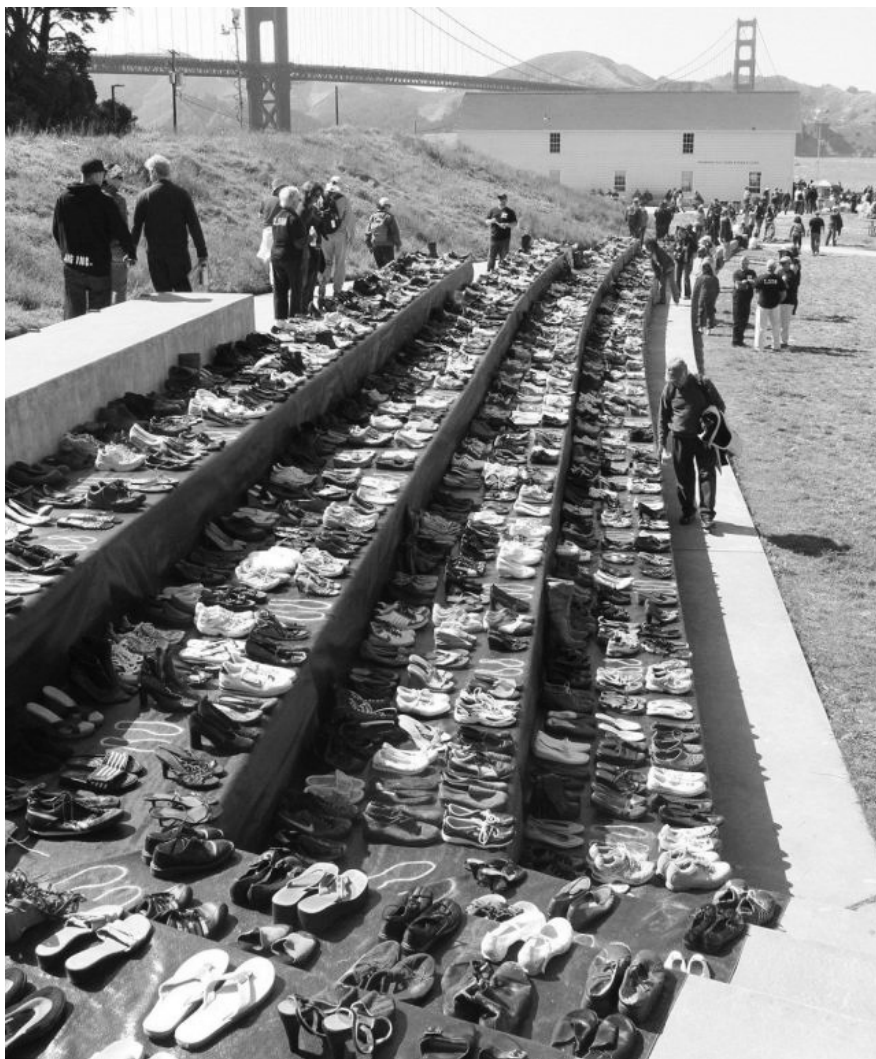
Kiállítás (vásár?) a Golden Gate hídnál hátrahagyott cipőkből

feszor, a public intellectuell , akinek egyetlen kerek mondata sincs, amit ne lehetne azonnal politikai jelszóvá alakítani. Ezért van az, hogy ma már egyiküket sem lehet jó lelkiismerettel végighallgatni az „attitűdök” valamilyen pátosza nélkül. Aki a tisztánlátás végett egy mai filozófusra hivatkozva próbál politikailag állást foglalni, az épp a tisztánlátásról mondott le. Aki ma egy közéleti celeb szavaiba kapaszkodva próbálja magát igazolni, csak zsarnoki módon örökös saját korlátolt butasága fölött.