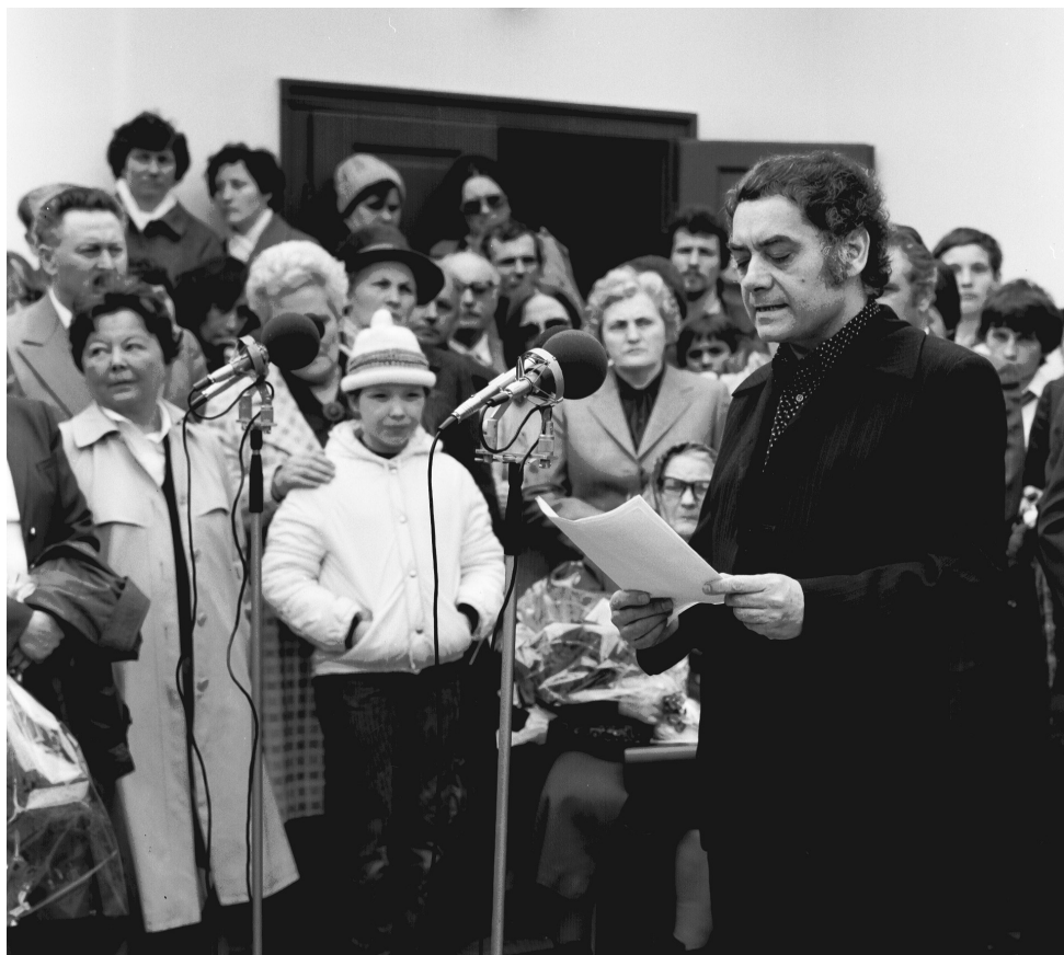
Csoóri Sándor Nagy László emlékházának avatásán, Isztkázon

Nyugodjál békében Sándor! Aggodalomra semmi ok. Sokan vagyunk még, akik a nemzet(ség) javát igyekszünk szolgálni, s nyomunkban jönnek a fiatalok!