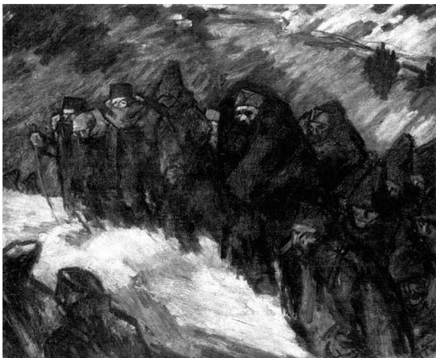
Vaszary János: Katonák egy kárpáti faluban (olaj, 1915)

Magyar–Lengyel Kurír , XXIV. évf. 4–7. sz., 1947. július 31., 14. Varsói levél.