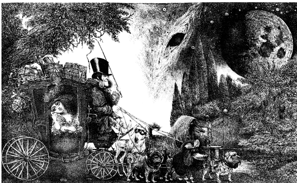
Romantikus lap kutyafogattal II. (litográfia, 1992)

BODA MAGDOLNA (1956) Szegeden élő költő. Utóbbi kötete: Óperenciás lavór víz (2011).