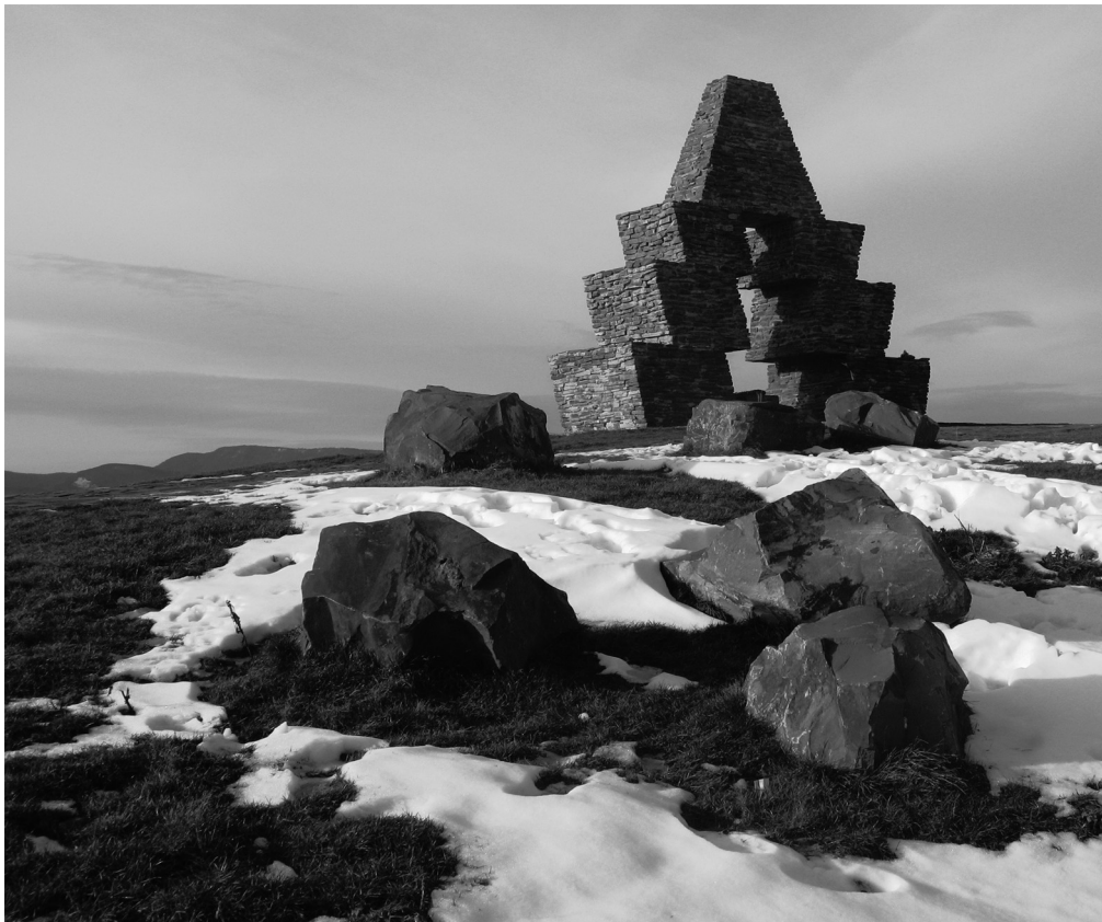
Millecentenáriumi bonfoglalási emlékmű. Vereckei-bágyó

CZAKÓ GÁBOR (1942) Budapesten élő író, kritikus, képzőművész. Legutóbbi kötete: Eredeti magyar nyelvtan (2011).