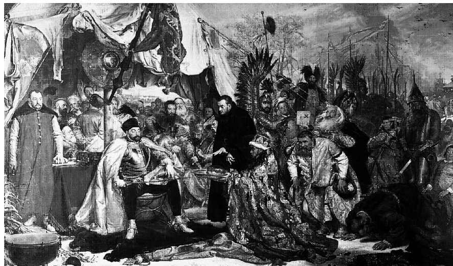
Báthory Pszkov előtt. Jan Matejko festménye szolgált a szobor alapjául