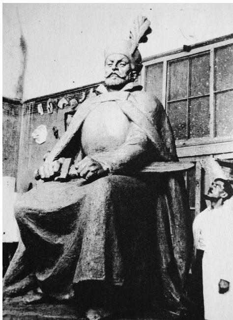
Báthory István bronzszobra, Farkas Béla alkotása