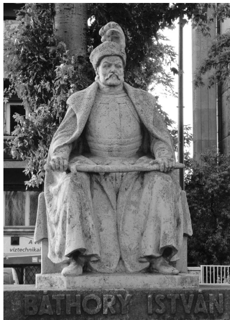
Az ülő Báthory. Pásztor János alkotása