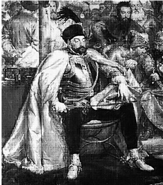
Jan Matejko festményének nagyított változata