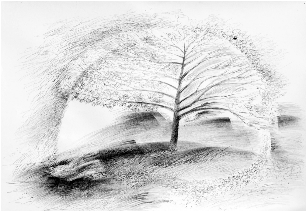
Égen és földön

hajad kislányosan őszinte volt a széllel ahogy kimenttél váratlanul a Bükkből szerte a zöldek azt fontolgatták tudnak-e szebbet jobbat örömiinkre jó itt mosolyogtad és azt hiszem így volt egy bokor diszkrét árnyékában fűrészeltük meg parázsló szíviink valahol nyár volt és mi ott voltunk mindenütt egy szavamba kapaszkodtál így nem félnek szédítő szakadék felett sem mondtad és mintha cigarettafüst ment volna a szemedbe egy dundi könnycsepp nagyítóján át kezdtél nézni rám miközben lelkesen tücsök ciripelt és örömében a fű földig hajolt szerelmes lépteink előtt