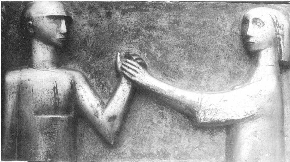
Fiú és lány