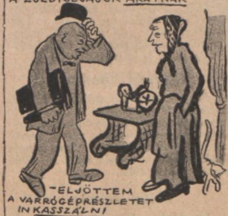
"ELJÖTTEM A VARRÓGÉPRÉSZLETET IN KASSZÁLN!