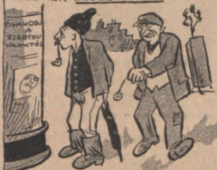
A ZSEBTOLVAJOK ARATNAK