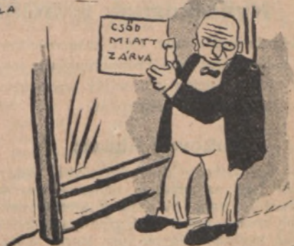
A GOND AZ ARCOKRA BARÁZDAT SZÁNT