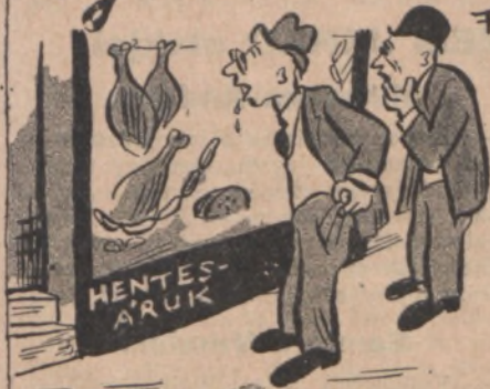
A SZEMEK LECELTETÉSE