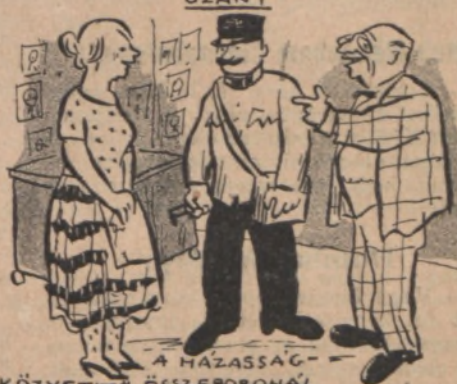
A HÁZASSÁG- KÖZVETÍTŐ ÖSSZEBORONÁL