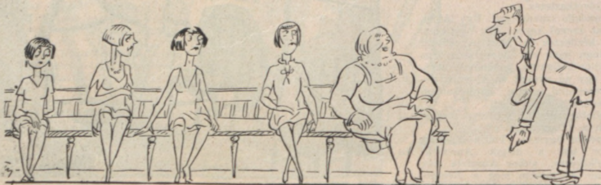
Az Erdélyi-pör tárgyalásáról annyi hisztérika szorult ki, hogy a bíróság kénytelen volt egy pót-Erdélyit beszerezni.