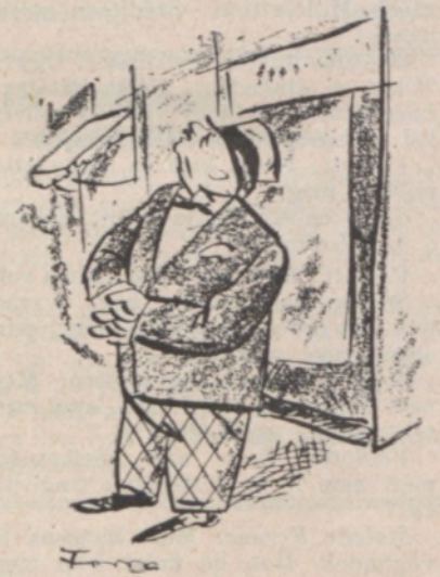
A külpolitikai helyzet, vagy: valami lóg a levegőben.