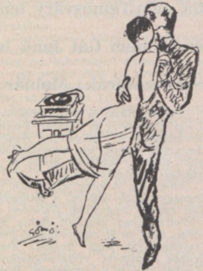
Mi okosabb vajjon: táncolni, vagy verset írni? — sóhajtott fel Szép Ernő, amikor „Gyermekjáték” című versét betiltották.