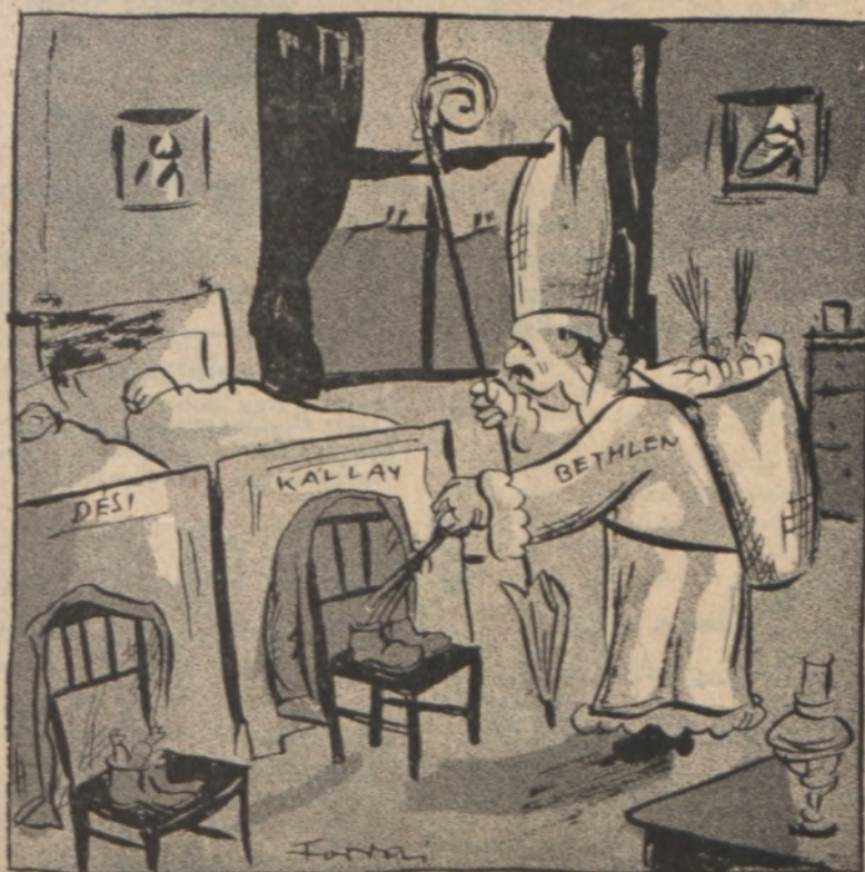
A Mikulás a jó gyerekeknek cukrot, a rossz gyerekeknek virgácsot hoz.