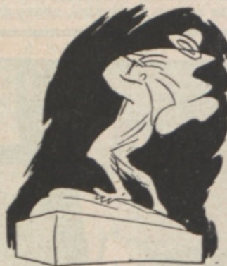
Kép az angliai orkán pusztításáról. Egy politikus szobra: a szél éppen kifordítja a köpenyét.