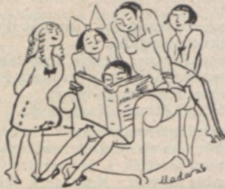
Adalék a mai leányneveléshez, vagy: akik nem tudtak bejutni az Erdélyi-pör tárgyalására.