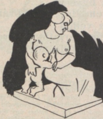
Egy cenzor, amint az anyatejjel szívja magába az irodalmi érzéket.