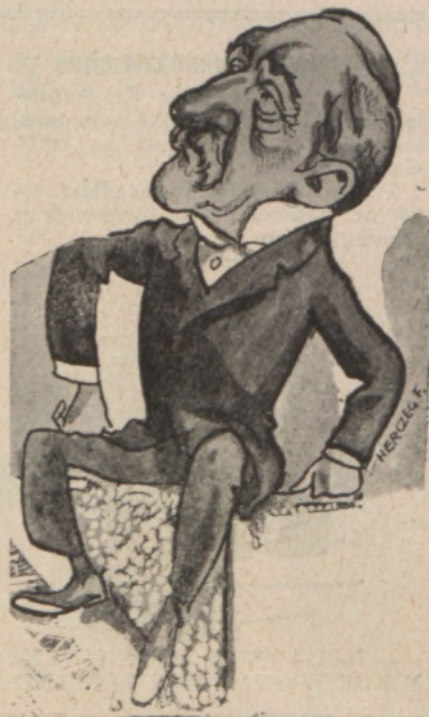
a „Déryné ifjasszony” szerzője