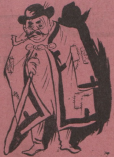
Bemutatjuk a kigazdák állásfoglalását a Bethlen—Kállay-ügyben. Az álláspont jelen pillanatban nem látható, mert suba alatt van.

Pirandellot sokan összetévesztik Porzsolt Kálmánnal. Ez alkalomból közöljük mindkettőjük arcképét.