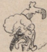
Megnyílik a parlament: Kuna Pé fölébred nyári álmából.