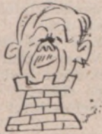
Bethlen sakkozik, vagy: Bud, az eltolt bástya.