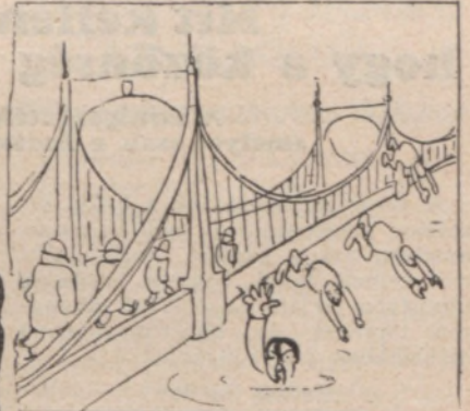
Őszi esendélet a Dunaparton, vagy: hogy ugratják különböző gazdasági reformokkal a pesti polgárt.