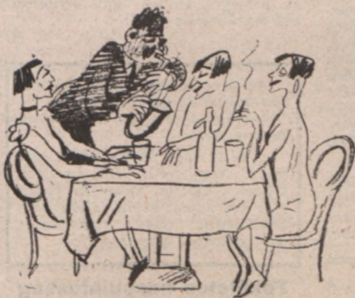
A világ múzeumigazgatói Budapesten tartottak kongresszust. Ez alkalmából bemutatunk három múzeumi darabot.