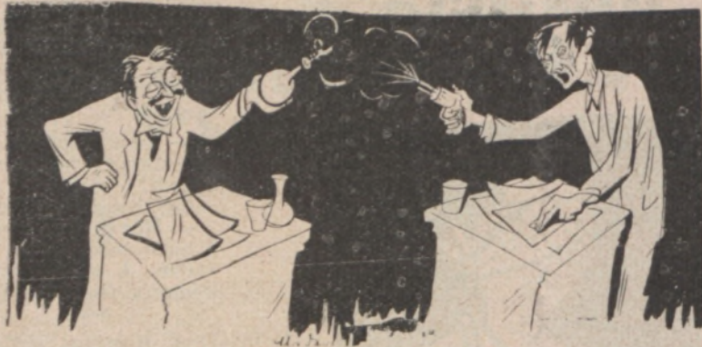
Rondics Jása montenegrói képviselő szűzbeszéde