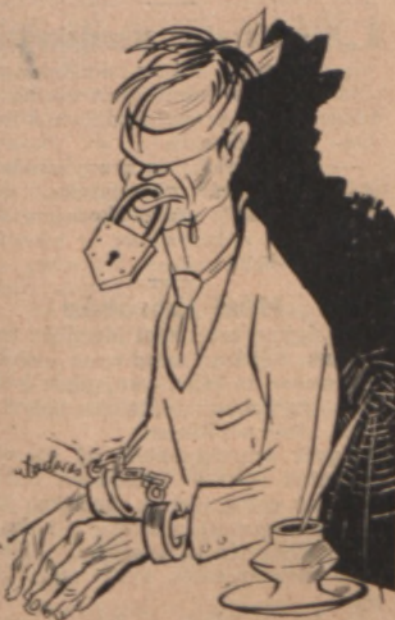
Őt a vadász hosszú, néma kussben ...